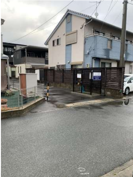
【現況写真】東側敷地