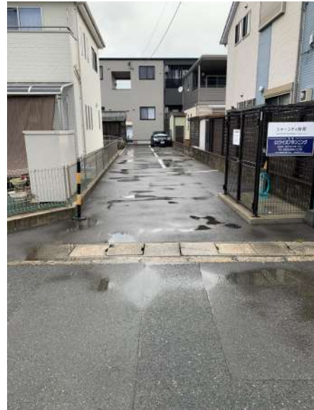
【現況写真】東側敷地