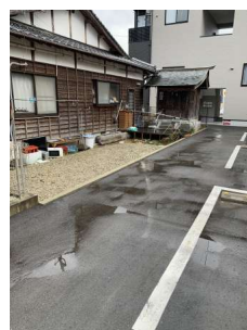
【現況写真】東側敷地界面