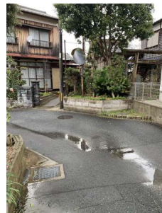
【前面道路含む現地写真】南西側公道界面