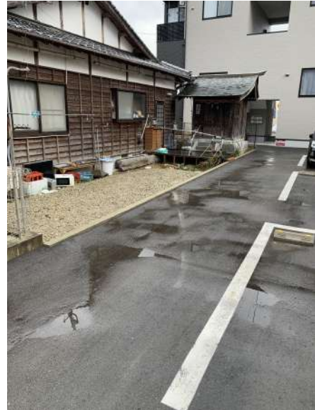
【現況写真】東側敷地接面