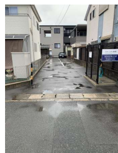
【現況写真】東側敷地