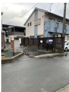
【現況写真】東側敷地