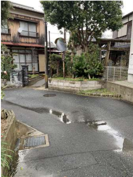
【前面道路含む現地写真】南西側公道接面