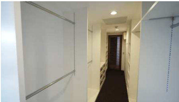
納戸(ウォークインクローゼット)