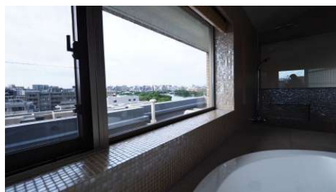
ジャグジーバスからのロケーション