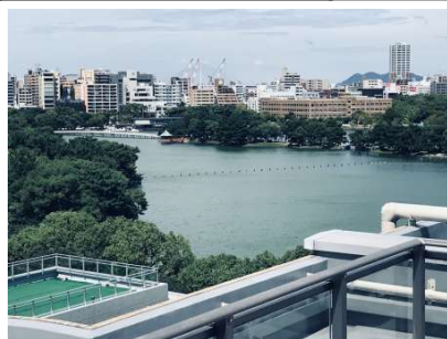
ルーフバルコニー2階