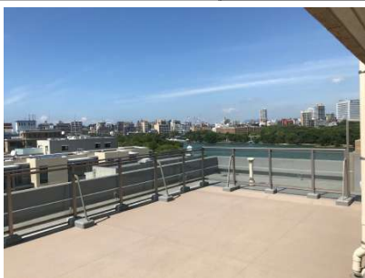
ルーフバルコニー1階