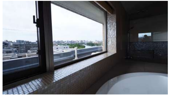
ジャグジーバスからのロケーション