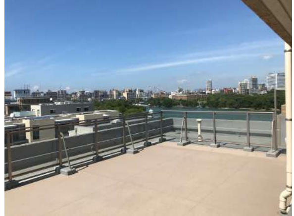
ルーフバルコニー1階