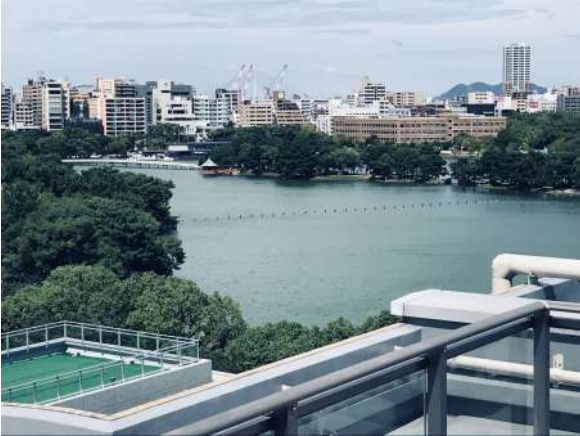
ルーフバルコニー2階