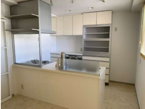
【ダイニングキッチン】