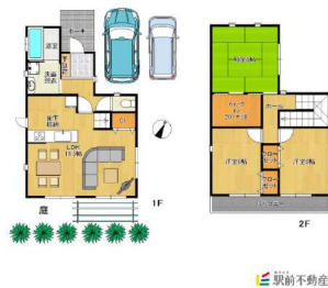
住み心地良い間取り