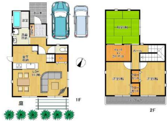
住み心地良い間取り