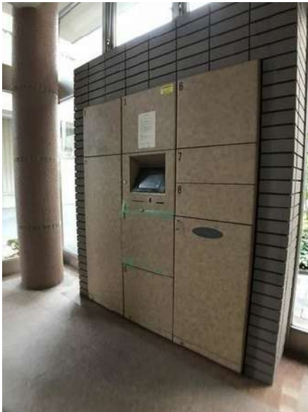
【宅配ボックス】宅配ボックス