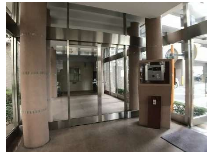
【エントランス(外)]エントランス