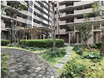
【エントランス(外)]アプローチ