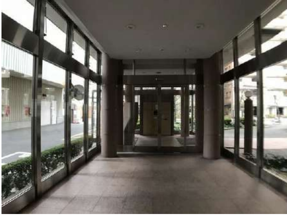
【エントランス(外)】エントランス