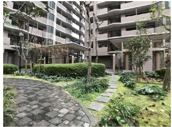
【エントランス(外)】アプローチ