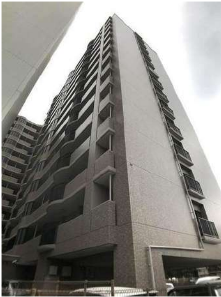
【外観写真】外観写真