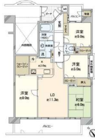
【間取り図】間取り図