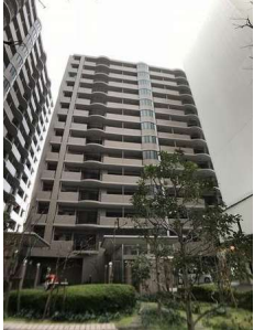
【外観写真】外観写真