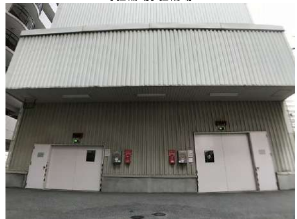
【駐車場】タワーパーキング