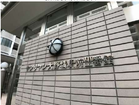
【外観写真】外観写真