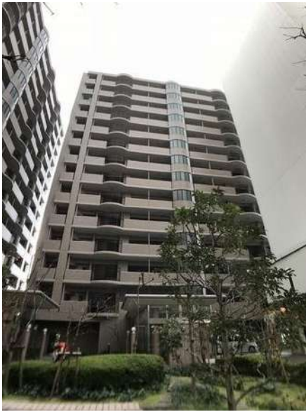
【外観写真】外観写真