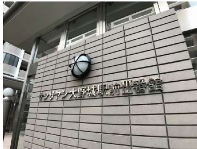
【外観写真】外観写真