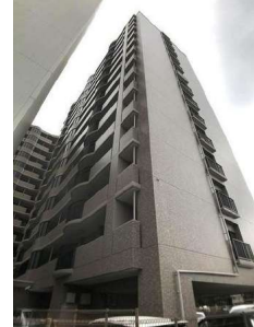
【外観写真】外観写真