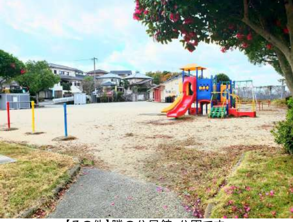
【その他】隣の公民館・公園です。