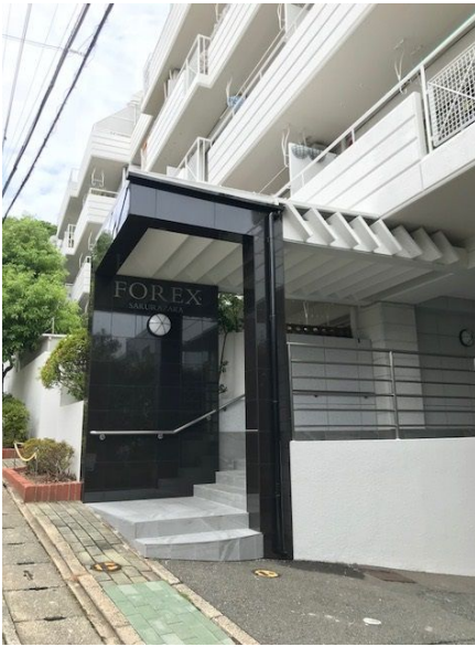
大規模修繕工事済み