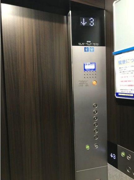
大規模修繕工事済み