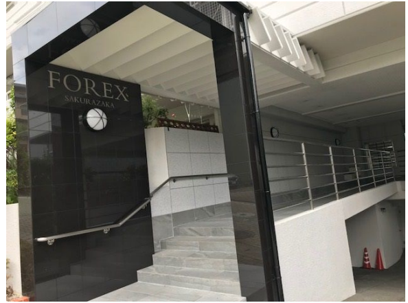
大規模修繕工事済み