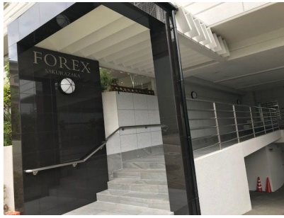
大規模修繕工事済み