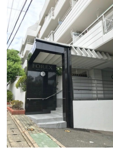
大規模修繕工事済み