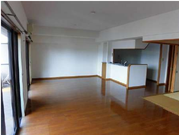
【リビングダイニング】