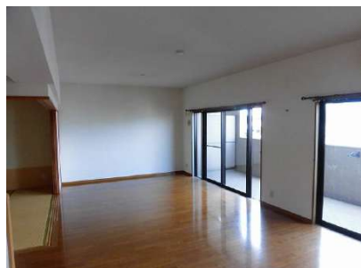
【リビングダイニング】