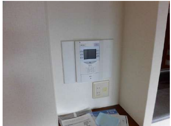
【TVモニタ付きインターフォン】