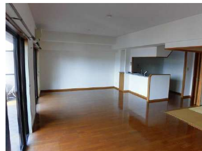
【リビングダイニング】