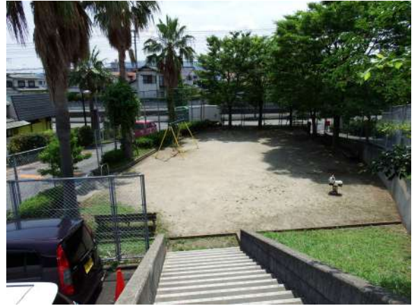
【その他共用部】マンション敷地内に公園