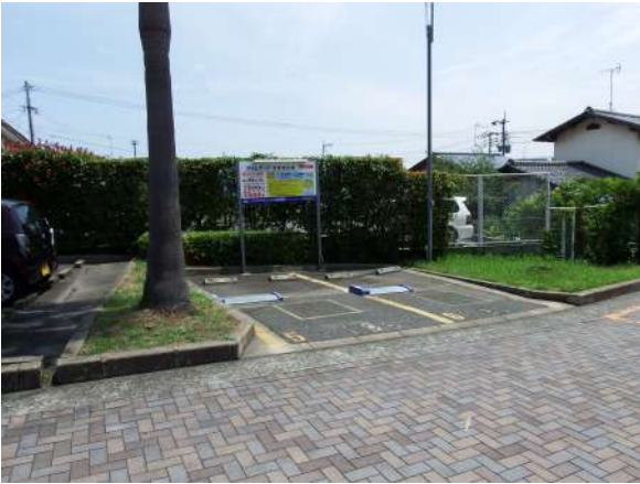
【駐車場】来客用にコインパーキング完備