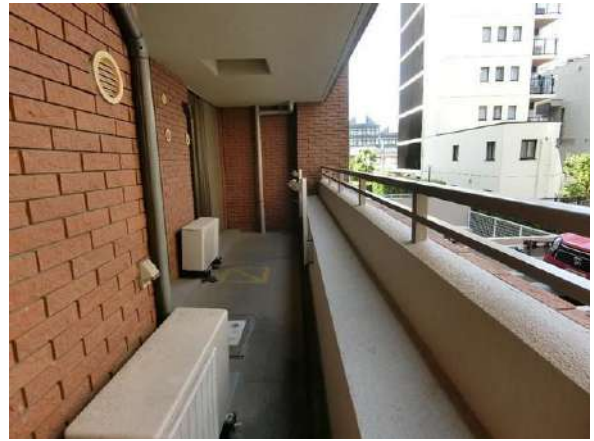
【バルコニー】バルコニー