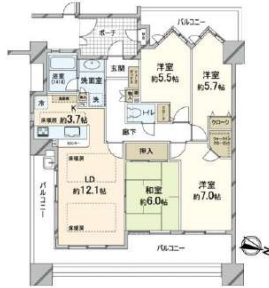
【間取り図】間取り図