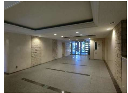
【エントランスホール】エントランス