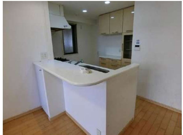
【キッチン】キッチン