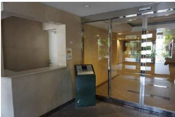
【エントランスホール】エントランス