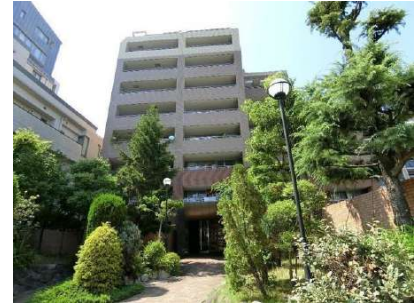
【外観写真】外観写真