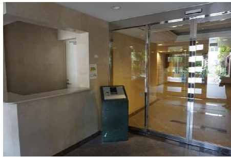
【エントランスホール】エントランス