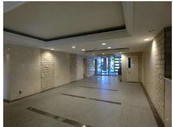
【エントランスホール】エントランス