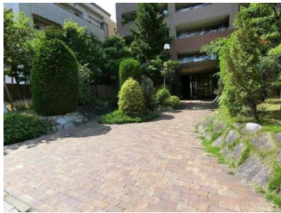
【外観写真】アプローチ