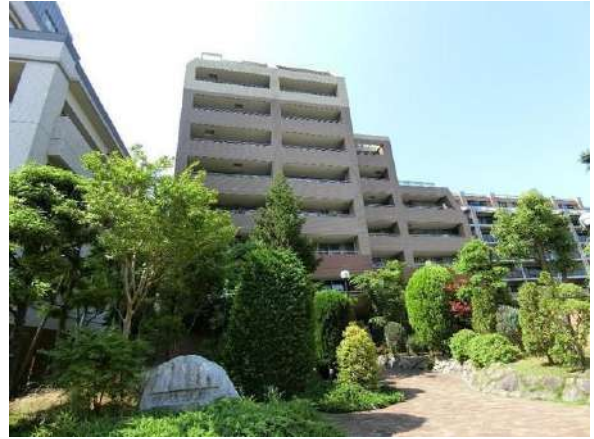
【外観写真】外観写真