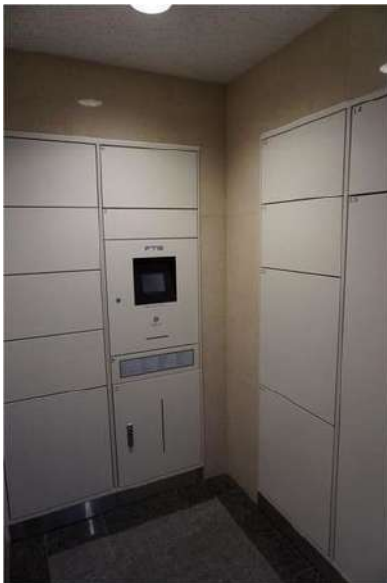
【宅配ボックス】宅配BOX