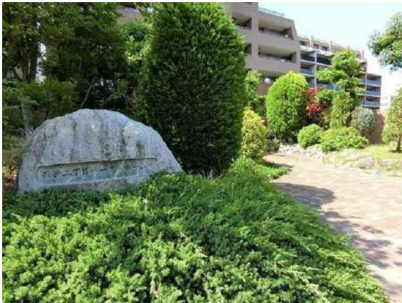
【外観写真】エンブレム