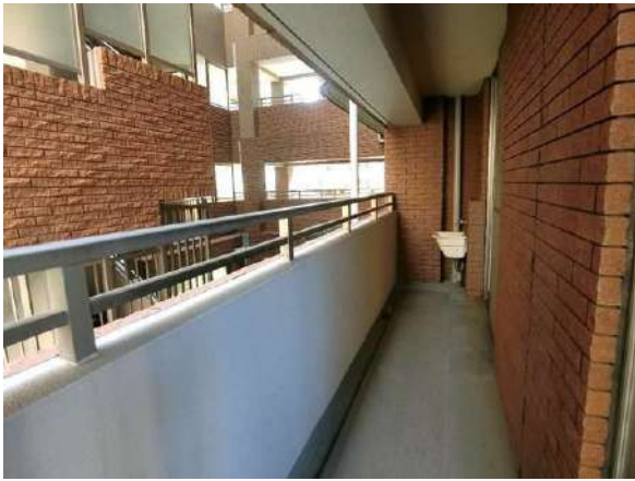
【バルコニー】バルコニー