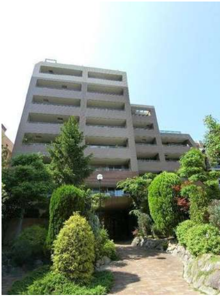
【外観写真】外観写真