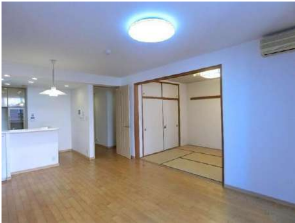
【リビングダイニング】リビング・ダイニング