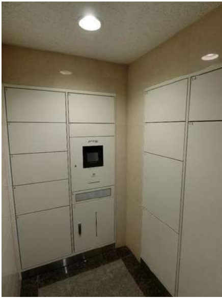
【宅配ボックス】宅配BOX