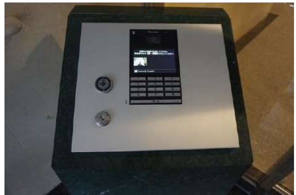
【その他共用部】オートロック