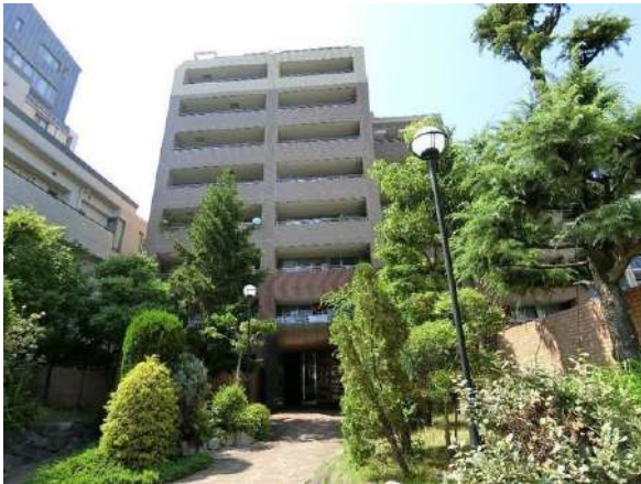
【外観写真】外観写真