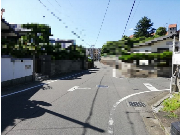
【前面道路含む現地写真】