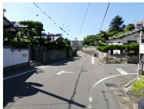
【前面道路含む現地写真】