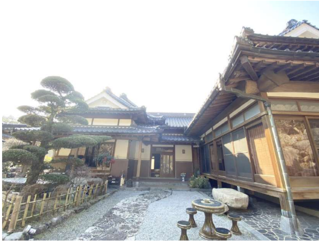
[外観・現況][現況外観写真]地下室・付属建物付豪華な平屋です。敷地も広大です。