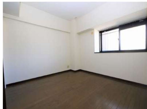
[専用部・室内写真][洋室]寝室や子供部屋にいかがでしょうか^^