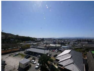
[専用部・室内写真][眺望]お部屋からの眺望です^^