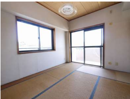
[専用部・室内写真][和室]来客のときや寝室にも使える和室があります♪