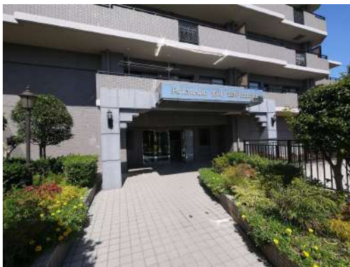
[外観・現況][エントランス(外)]マンションエントランスです^^