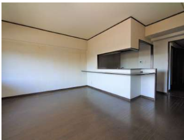
[専用部・室内写真][居間・リビング]リビングを見渡すことができるカウンターキッチンです^^