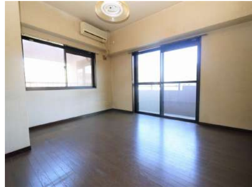
[専用部・室内写真][洋室]二面採光のお部屋なので明るく、換気もできます♪