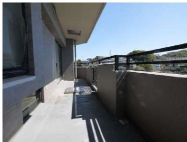
[専用部・室内写真][バルコニー]角部屋の二面バルコニーのお部屋です♪