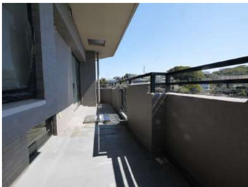
[専用部・室内写真][バルコニー]角部屋の二面バルコニーのお部屋です♪