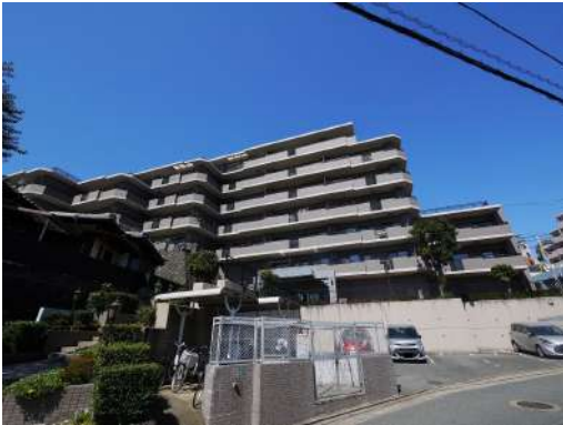
[外観・現況][外観写真]総戸数28戸、5階角部屋です^^