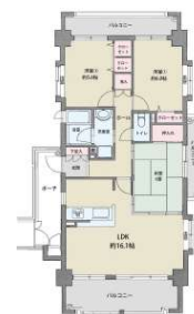
[間取り図・図面][間取り図]