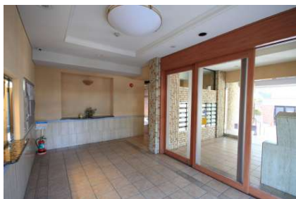
[共用部・設備施設][エントランスホール]