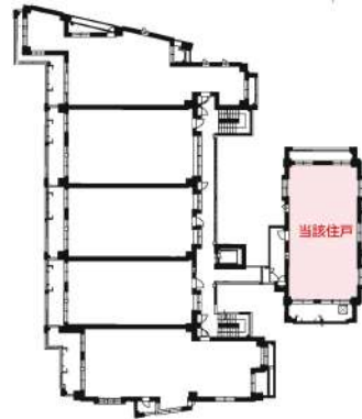
[間取り図・図面][間取り図]配置図