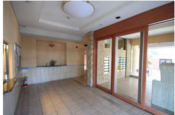
[共用部・設備施設][エントランスホール]