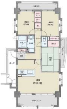
[間取り図・図面][間取り図]