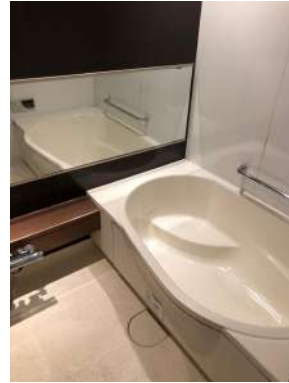
[専用部・室内写真][浴室]