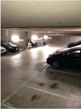
[共用部・設備施設][敷地内駐車場]