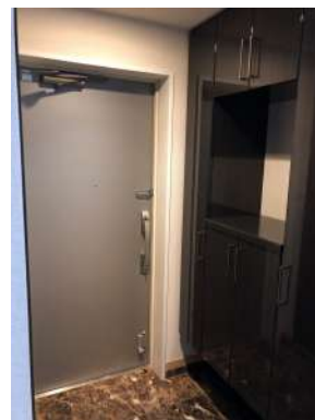
[専用部・室内写真][玄関]玄関には大型シューズボックスと大型物入でたっぷり収納できます