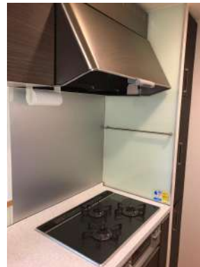
[専用部・室内写真][キッチン]