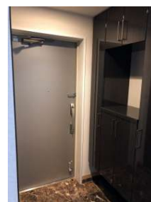
[専用部・室内写真][玄関]玄関には大型シューズボックスと大型物入でたっぷり収納できます