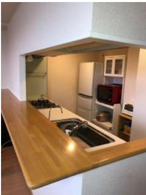
[専用部・室内写真][キッチン]対面式カウンターキッチンはダイニングとリビングを見渡せます。