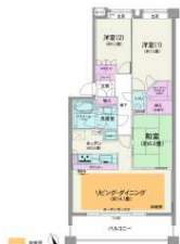
[間取り図・図面][間取り図]