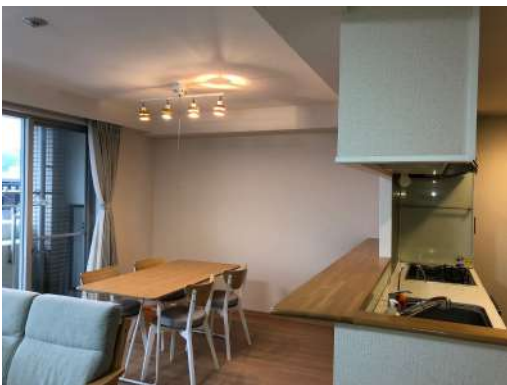
[専用部・室内写真][ダイニングキッチン]