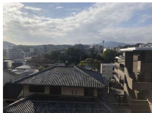
[専用部・室内写真][眺望]バルコニーからの眺めは遮る建物がありません。