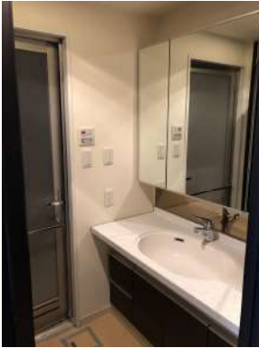
[専用部・室内写真][洗面化粧台]三面鏡収納付きで収納も充実。