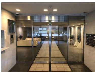
[共用部・設備施設][エントランスホール]