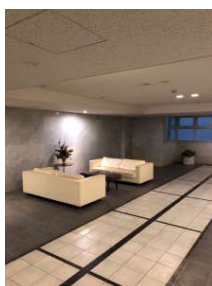
[共用部・設備施設][ラウンジ]エントランスラウンジは広くて豪華。