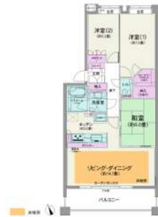
[間取り図・図面][間取り図]