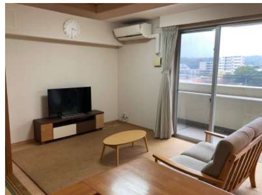
[専用部・室内写真][居間・リビング]大きな窓に面する広々リビング。