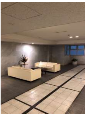
[共用部・設備施設][ラウンジ]エントランスラウンジは広くて豪華。