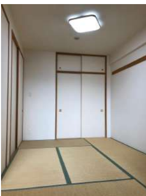
[専用部・室内写真][和室]リビングとつながる和室。