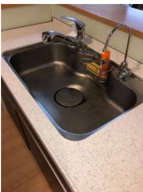
[専用部・室内写真][キッチン]浄水器に加え、食器洗い乾燥機も使えます。