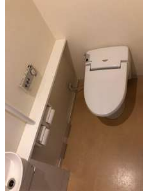
[専用部・室内写真][トイレ]手洗いカウンター付きの広いトイレ。