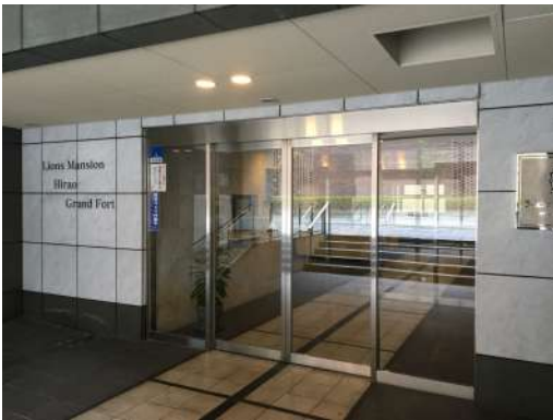
[共用部・設備施設][ロビー]