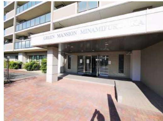
[外観・現況][外観写真]マンション入口にはスロープも付いています