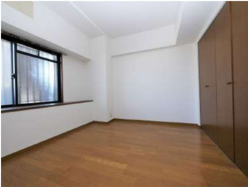
[専用部・室内写真][洋室]大容量の収納と十分な広さのお部屋は寝室にいかがでしょうか^^