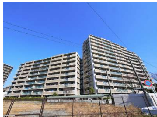
[外観・現況][外観写真]総戸数125戸のマンションです♪