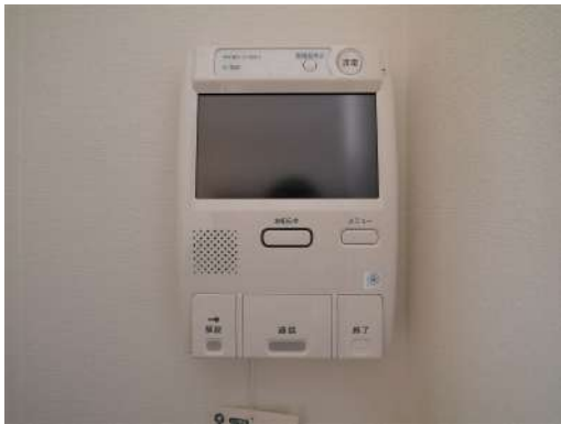
[専用部・室内写真][TVモニタ付きインターフォン]モニター付きのインターホンです^