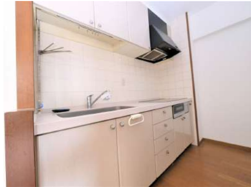
[専用部・室内写真][キッチン]オール電化のキッチンはお掃除も楽です^^