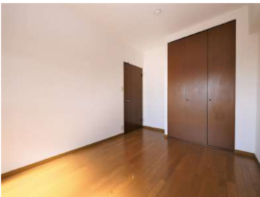
[専用部・室内写真][洋室]洋室には収納が付いています^^