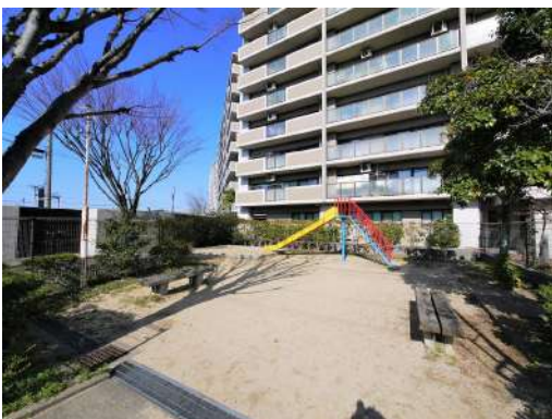
[外観・現況][外観写真]マンション敷地の横に遊具があります