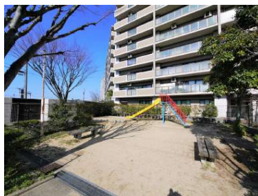
[外観・現況][外観写真]マンション敷地の横に遊具があります