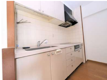
[専用部・室内写真][キッチン]オール電化のキッチンはお掃除も楽です^^