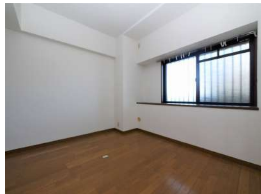
[専用部・室内写真][洋室]洋室には窓も付いているので換気できます^^