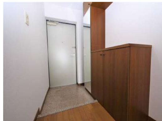
[専用部・室内写真][玄関]玄関には身だしなみチェックできる全身鏡が付いています^