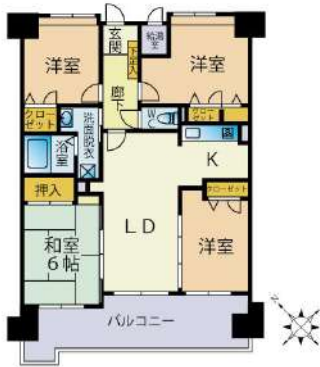
[間取り図・図面][間取り図]