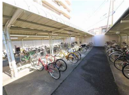
[共用部・設備施設][駐輪場]駐輪場は屋根付きのがあります^^