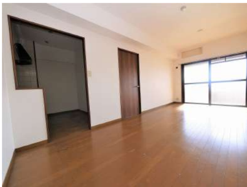
[専用部・室内写真][居間・リビング]リビング横の洋室をリビングとつなげて3LDKにもできます♪