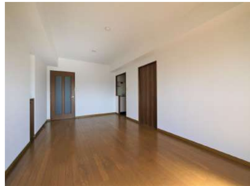
[専用部・室内写真][居間・リビング]リビングはダイニングスペースとソファスペースを分けられます