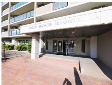
[外観・現況][外観写真]マンション入口にはスロープも付いています