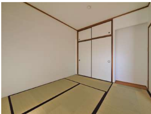
[専用部・室内写真][和室]洗濯ものを畳んだり来客時にも使える和室があります^^