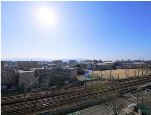
[外観・現況][外観写真]開放感のある眺望です