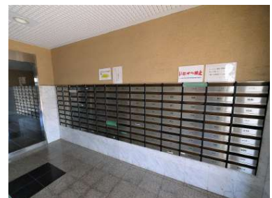
[共用部・設備施設][郵便受け]メールボックスはダイヤル付きです♪