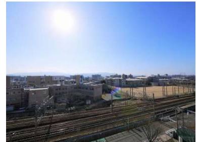
[外観・現況][外観写真]開放感のある眺望です