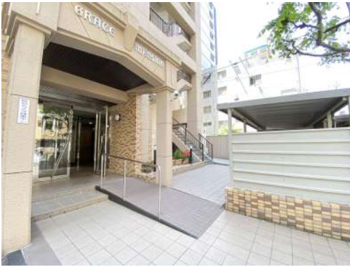
綺麗なエントランスです。