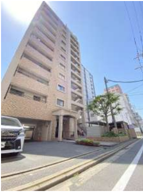
現地外観写真です。