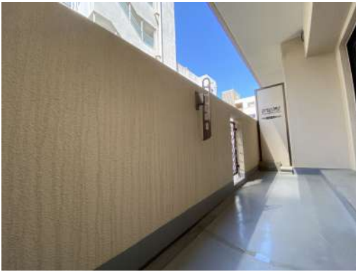
南西バルコニーです。