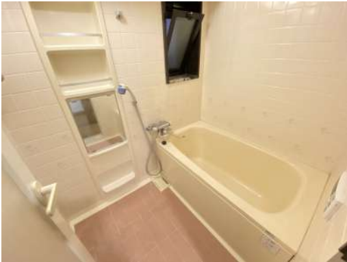
窓のついた浴室です。