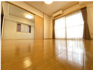
和室と繋がった広々としたリビングです。