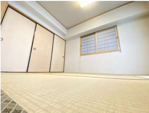
リビングに隣接した和室です。