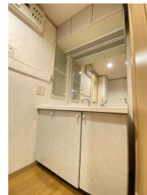
収納豊富な洗面台です。