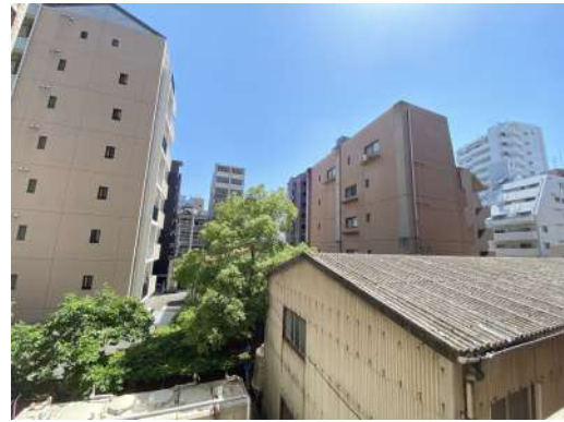
バルコニーからの眺望です。