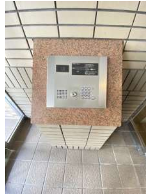
オートロックついております。