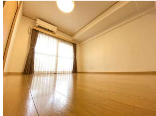
別角度からのリビング写真です。