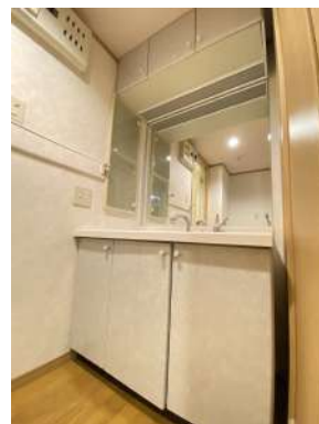
収納豊富な洗面台です。