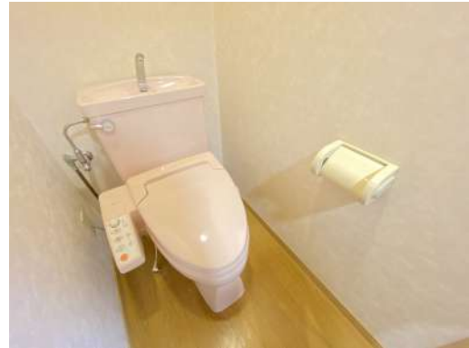
洗浄便座機能付きのお手洗いです。