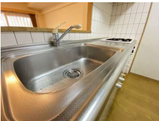
キッチン流し台も大変綺麗です。