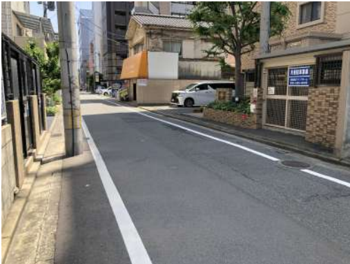
前面道路写真②です。