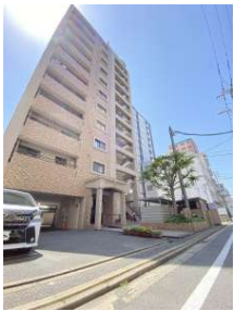
現地外観写真です。