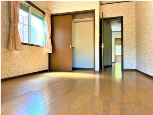
[専用部・室内写真][洋室]☆収納も有りま す☆