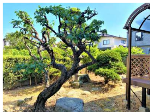
[共用部・設備施設][庭]☆お庭☆