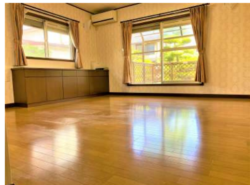
[専用部・室内写真][リビングダイニン グ]☆広々リビング日当たり良好☆