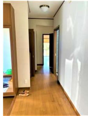
[専用部・室内写真][その他内観]☆廊下☆