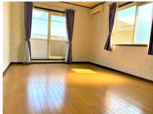
[専用部・室内写真][洋室]☆2F洋室②☆