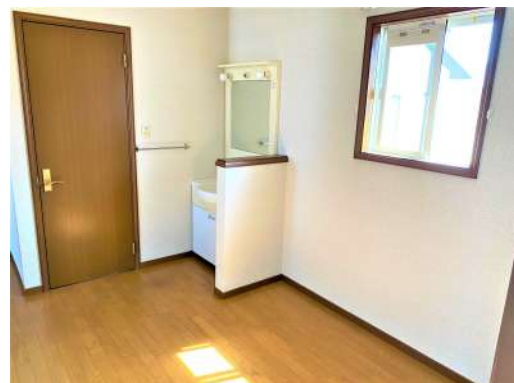
[専用部・室内写真][その他内観]☆2Fファミリースペース☆