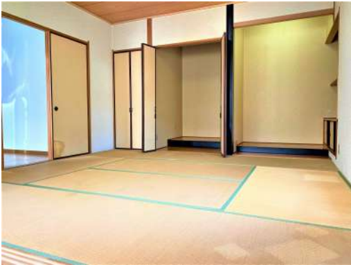
[専用部・室内写真][和室]☆和室写真②☆