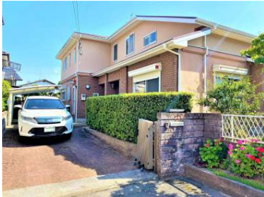
[外観・現況][外観写真]☆車も3台駐車可能☆