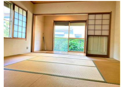
[専用部・室内写真][和室]☆和室写真①☆