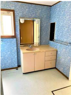
[専用部・室内写真][洗面化粧台]☆洗面所☆