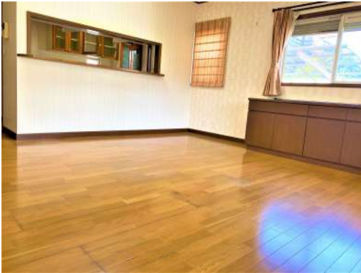
[専用部・室内写真][リビングダイニング]☆リビング写真②☆