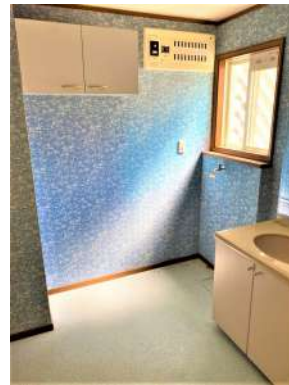
[専用部・室内写真][脱衣場]☆脱衣所☆