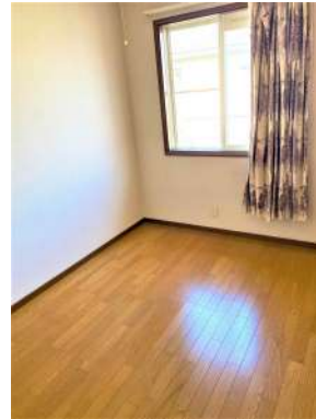
[専用部・室内写真][洋室]☆1F洋室☆