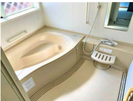
[専用部・室内写真][浴室]☆窓付きお風呂☆