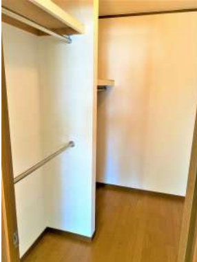
[専用部・室内写真][ウォークインクローゼット]☆ウォークインクローゼット①☆