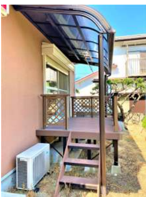
[共用部・設備施設][庭]☆ウッドデッキ☆