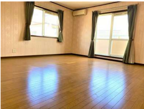
[専用部・室内写真][洋室]☆2F洋室①☆