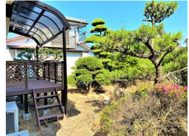
[その他][その他]☆ウッドデッキ有・お庭広々☆