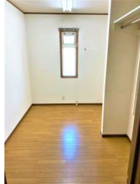
[専用部・室内写真][ウォークインクローゼット]☆ウォークインクローゼット②☆