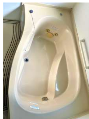
[専用部・室内写真][浴室]☆ジェットバス付き☆