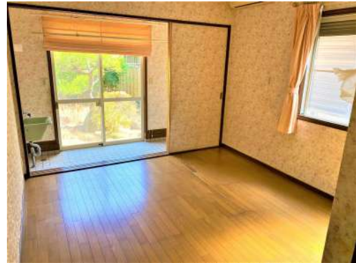
[専用部・室内写真][洋室]☆お庭の水やり もラクラク☆