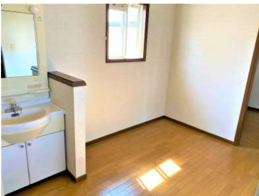
[専用部・室内写真][洗面化粧台]☆2Fにも洗面台☆