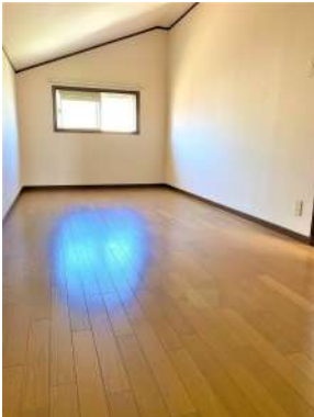
[専用部・室内写真][その他内観]☆2F納戸・子供部屋にも使えそうです☆