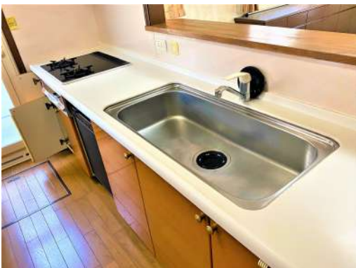
[専用部・室内写真][キッチン]☆調理スペー スゆったり☆