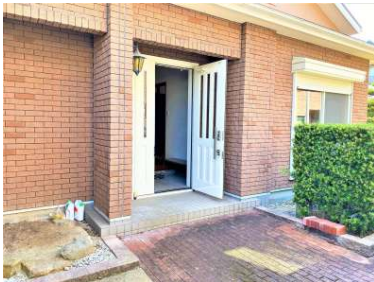
[専用部・室内写真][玄関]☆洋風な玄関☆