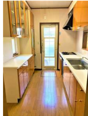
[専用部・室内写真][キッチン]☆勝手口付 きでゴミ捨ても楽ちん☆