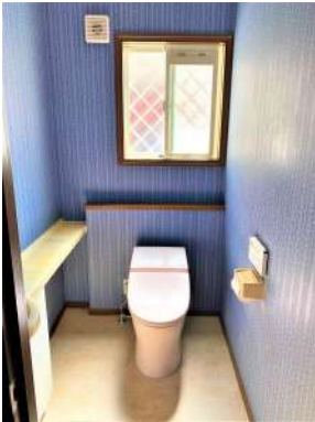
[専用部・室内写真][トイレ]☆1F窓付きリ フォーム済みタンクレストイレ☆