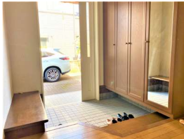
[専用部・室内写真][玄関]☆収納有☆