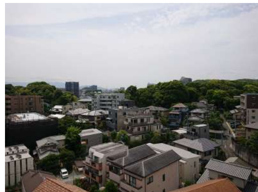
[専用部・室内写真][眺望]