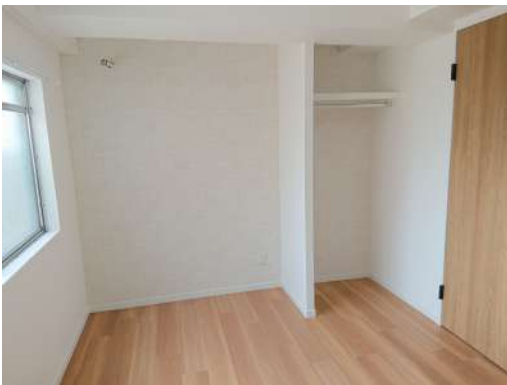
[専用部・室内写真][洋室]