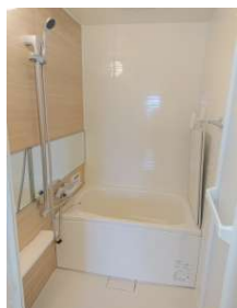
[専用部・室内写真][浴室]