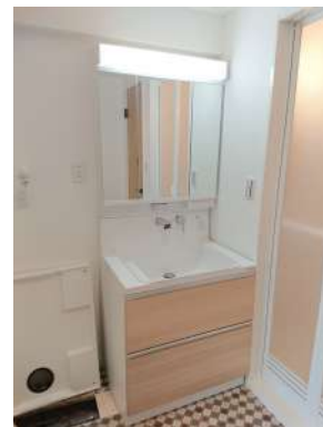
[専用部・室内写真][洗面化粧台]