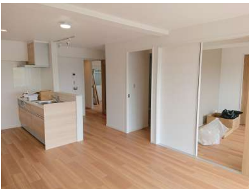
[専用部・室内写真][居間・リビング]