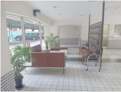
[共用部・設備施設][エントランスホール]