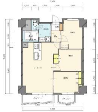
[間取り図・図面][間取り図]