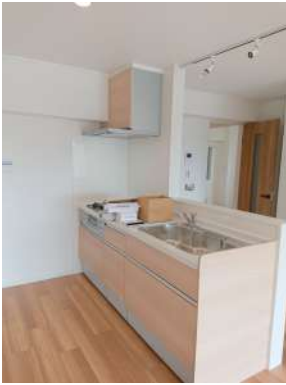
[専用部・室内写真][キッチン]