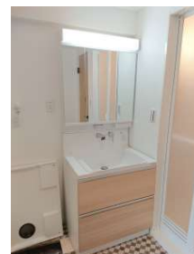
[専用部・室内写真][洗面化粧台]