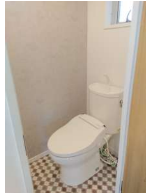
[専用部・室内写真][トイレ]