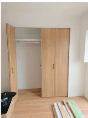
[専用部・室内写真][洋室]