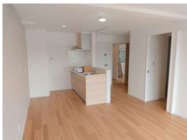
[専用部・室内写真][居間・リビング]