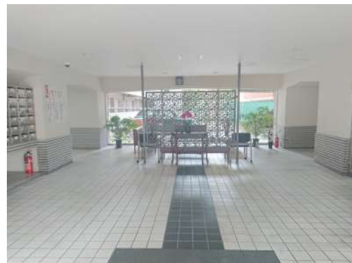
[共用部・設備施設][エントランスホール]