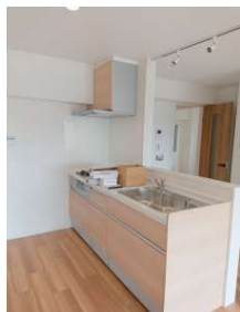
[専用部・室内写真][キッチン]