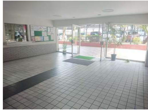
[共用部・設備施設][エントランスホール]