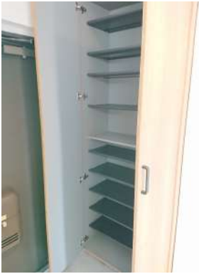
[専用部・室内写真][玄関]