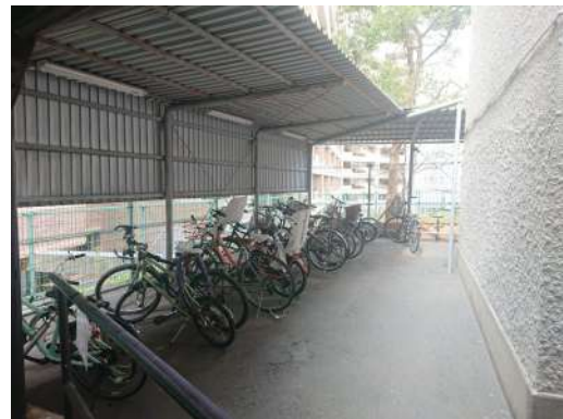
[共用部・設備施設][駐輪場]