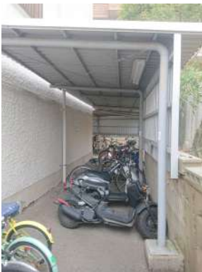
[共用部・設備施設][駐輪場]