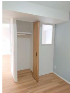
[専用部・室内写真][洋室]