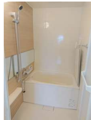
[専用部・室内写真][浴室]