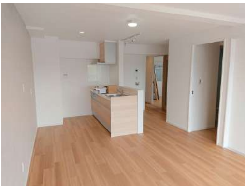
[専用部・室内写真][居間・リビング]