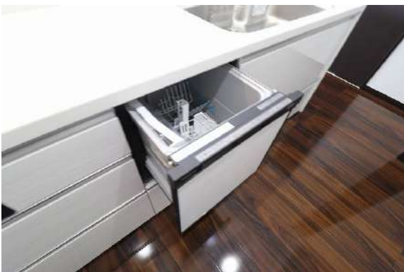
[専用部・室内写真][キッチン]