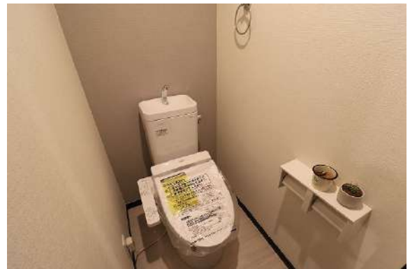
[専用部・室内写真][トイレ]