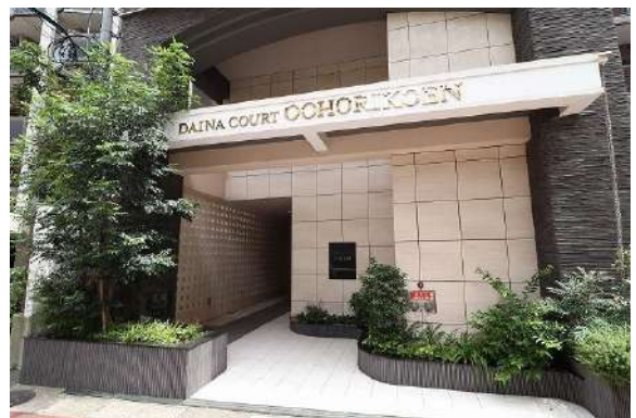
[共用部・設備施設][エントランスホール]