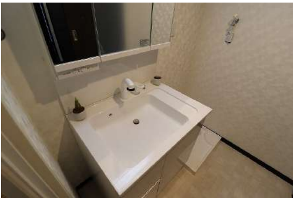
[専用部・室内写真][洗面化粧台]