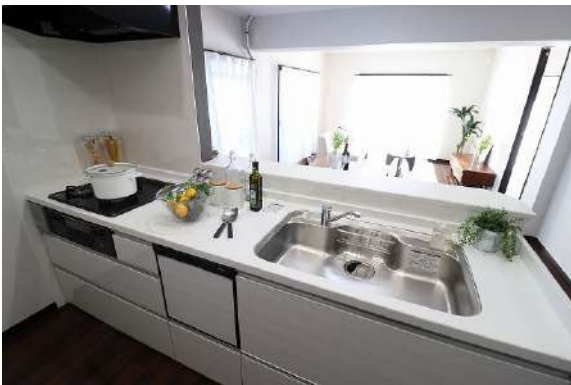
[専用部・室内写真][キッチン]