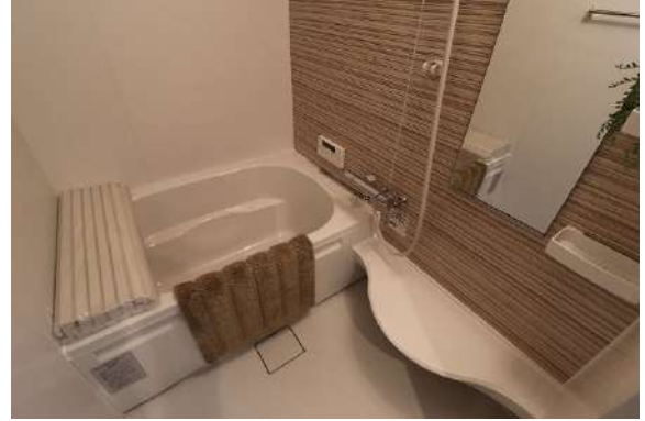
[専用部・室内写真][浴室]