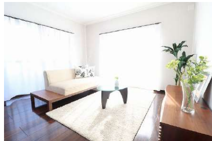
[専用部・室内写真][リビングダイニング]