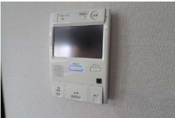
[専用部・室内写真][TVモニタ付きインターフォン]