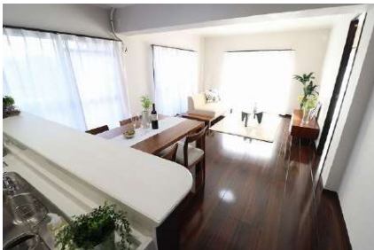
[専用部・室内写真][居間・リビング]