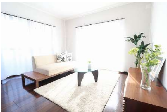
[専用部・室内写真][リビングダイニング]