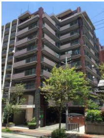
[外観・現況][現況写真]マンション外観