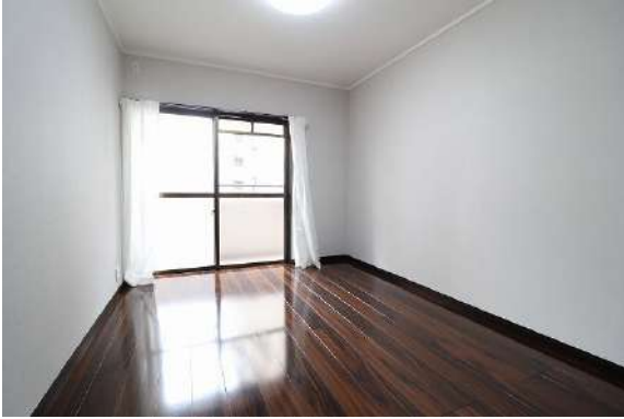
[専用部・室内写真][洋室]