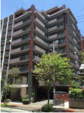
[外観・現況][現況写真]マンション外観