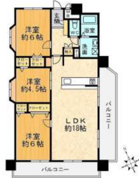
[間取り図・図面][間取り図]間取り図