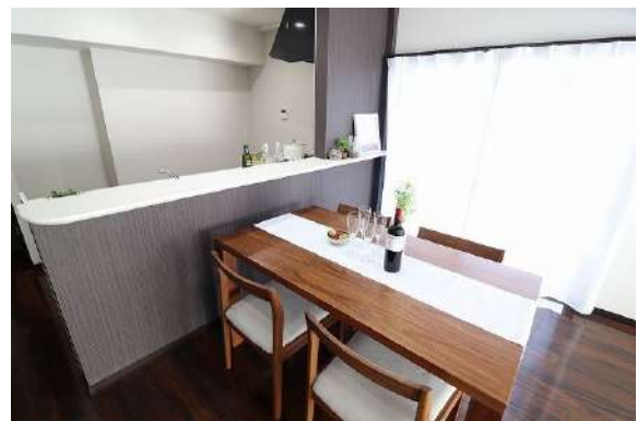
[専用部・室内写真][ダイニングキッチン]