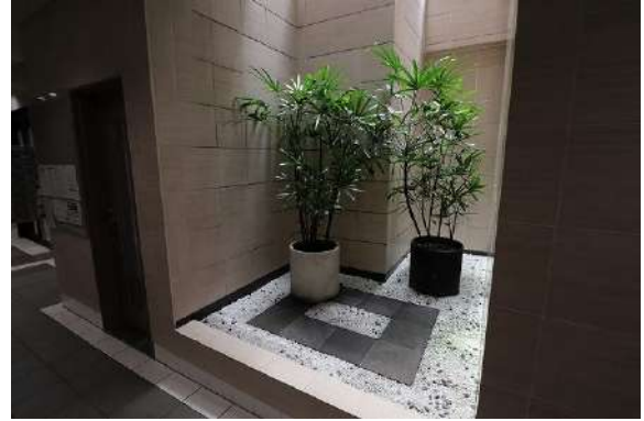
[共用部・設備施設][エントランスホール]