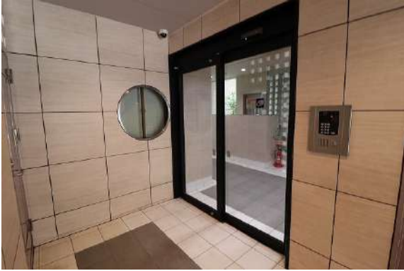
[共用部・設備施設][エントランスホール]