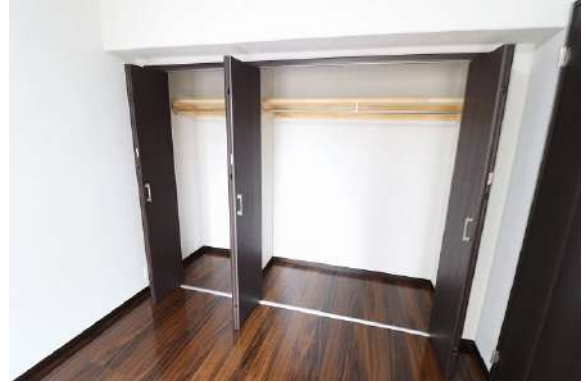
[専用部・室内写真][収納]