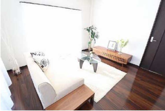
[専用部・室内写真][居間・リビング]