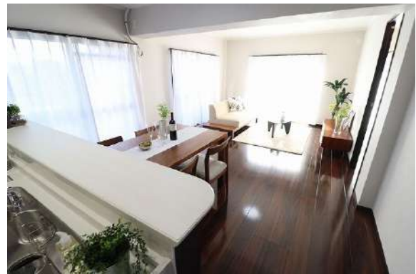
[専用部・室内写真][居間・リビング]