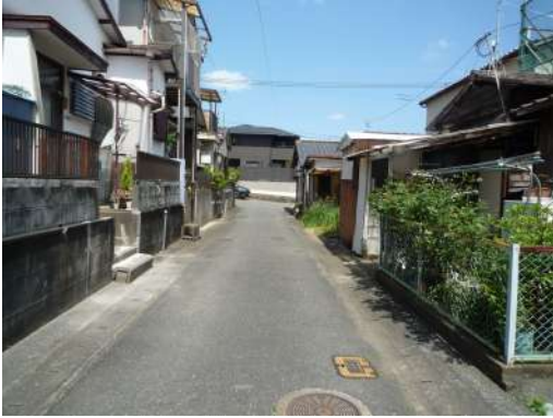
[外観・現況][前面道路含む現地写真]