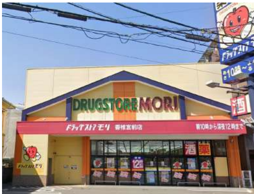
[その他][その他]ドラッグストアモリ香椎宮前店 423m