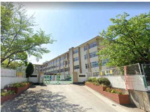
[その他][その他]福岡市立香椎東小学校 996m