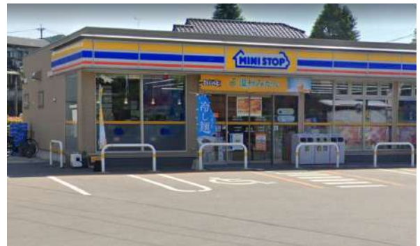
[その他][その他]ミニストップ福岡香椎6丁目店 475m