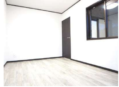
南西側6帖洋室です。和室を洋室に変更しました。