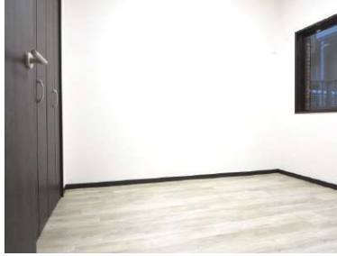
北側5帖洋室です。大容量の収納があり扉は新品の交換しました。