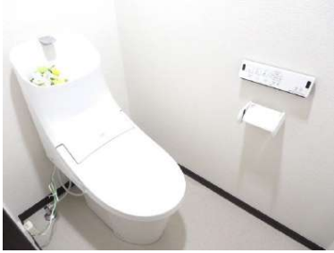
TOTO製新品の便器・便座に交換しました。