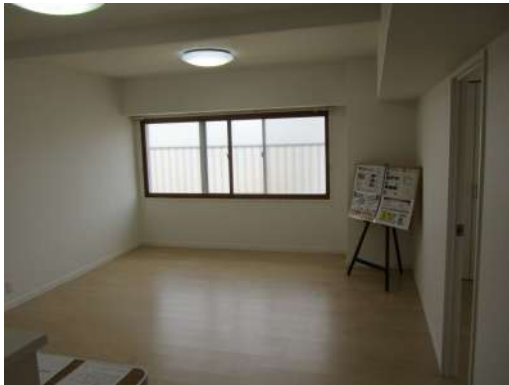
[専用部・室内写真][ダイニングキッチン]