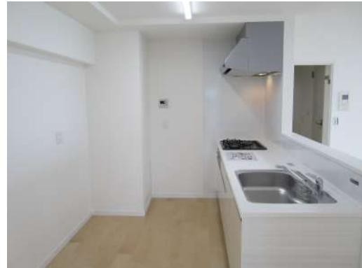
[専用部・室内写真][キッチン]