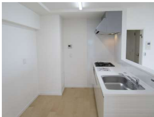
[専用部・室内写真][キッチン]