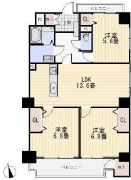
[間取り図・図面][間取り図]