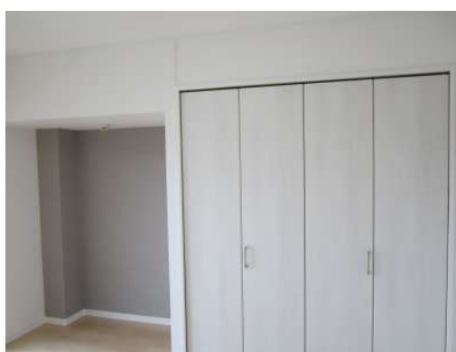
[専用部・室内写真][収納]