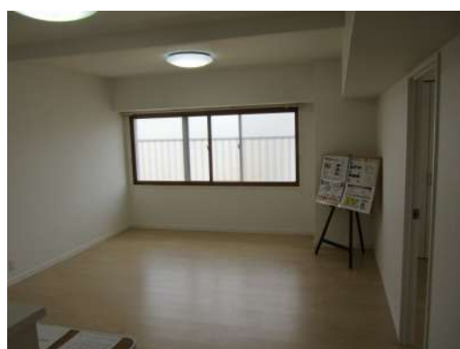
[専用部・室内写真][ダイニングキッチン]