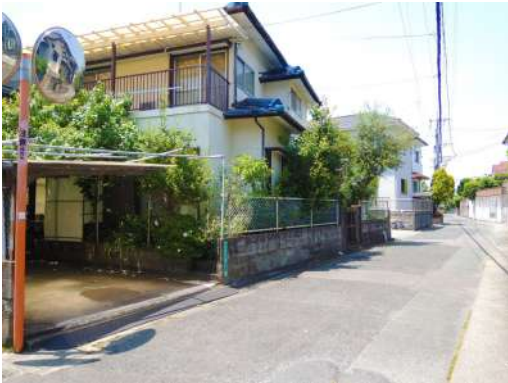
[外観・現況][前面道路含む現地写真]