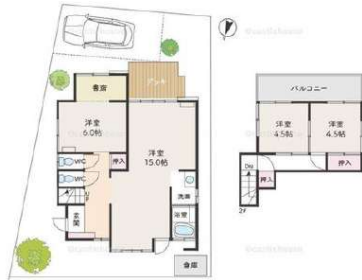
[間取り図・図面][間取り図]