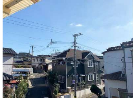
[専用部・室内写真][眺望]