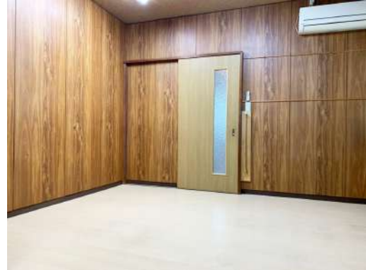
[専用部・室内写真][洋室]