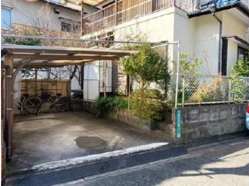
[共用部・設備施設][駐車場]