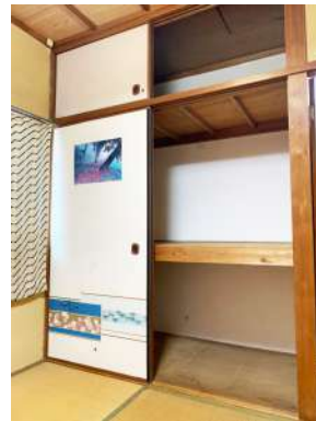
[専用部・室内写真][収納]