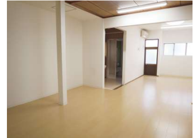
[専用部・室内写真][居間・リビング]