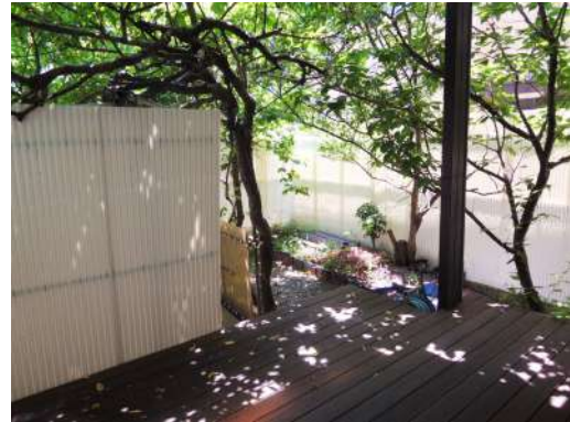
[共用部・設備施設][庭]