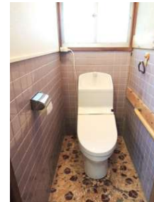
[専用部・室内写真][トイレ]