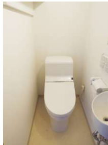
[専用部・室内写真][トイレ]