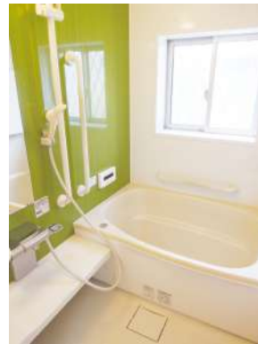
[専用部・室内写真][浴室]