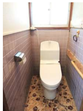
[専用部・室内写真][トイレ]