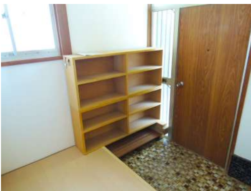
[専用部・室内写真][玄関]