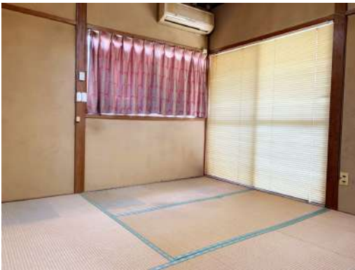
[専用部・室内写真][和室]