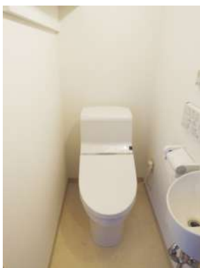
[専用部・室内写真][トイレ]