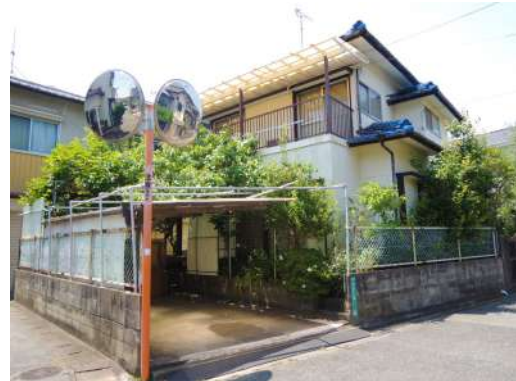
[外観・現況][外観写真]