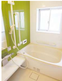
[専用部・室内写真][浴室]