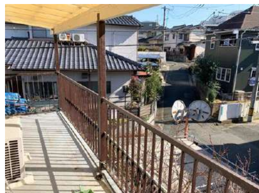
[専用部・室内写真][バルコニー]