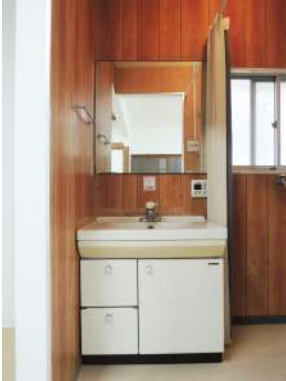
[専用部・室内写真][洗面化粧台]