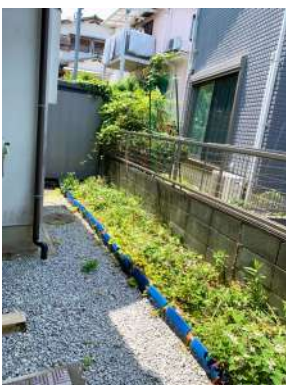
[共用部・設備施設][庭]