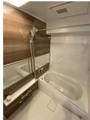
[専用部・室内写真][浴室]