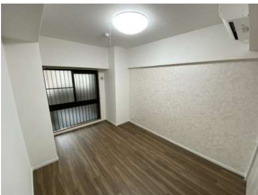
[専用部・室内写真][洋室]