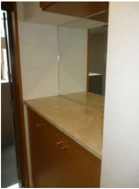
[専用部・室内写真][玄関]