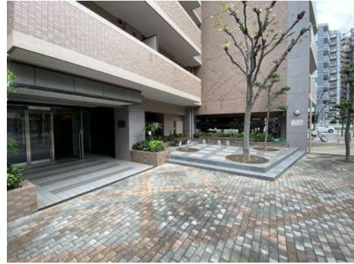
[外観・現況][エントランス（外）]