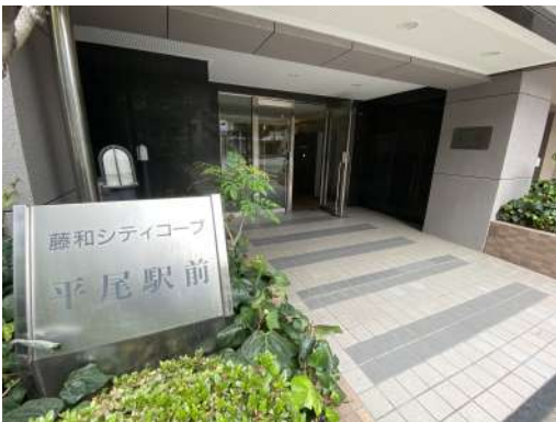
[外観・現況][エントランス（外）]