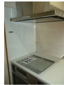
[専用部・室内写真][キッチン]