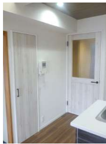
[専用部・室内写真][その他内観]☆建具取替えています☆