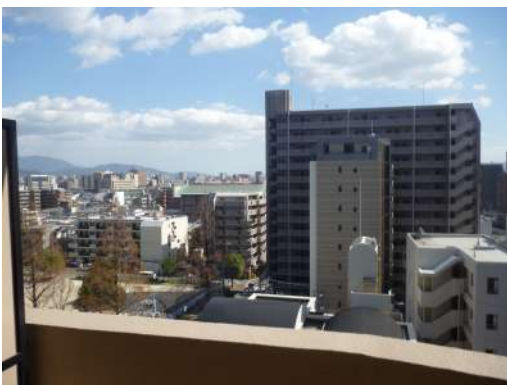
[専用部・室内写真][バルコニー] ☆朝の光に澄んだ空気を感じられるバルコニーです ☆