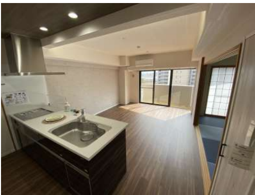
[専用部・室内写真][ダイニングキッチン]