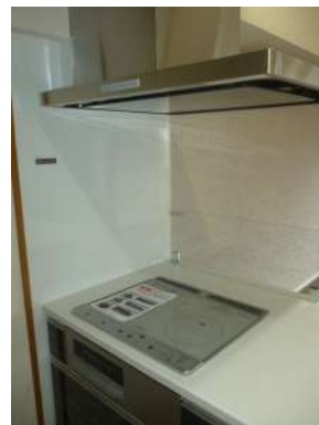
[専用部・室内写真][キッチン]