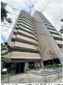
[外観・現況][外観写真]☆建物の温かい色合いが周辺風景とやさしく溶け合っています☆