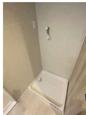
[専用部・室内写真][ランドリースペース]