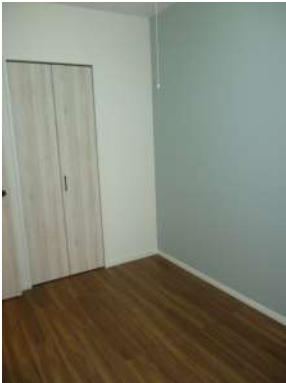
[専用部・室内写真][洋室]☆収納たっぷり☆