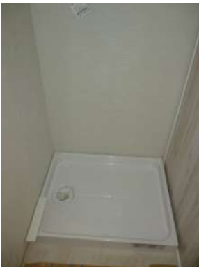
[専用部・室内写真][ランドリースペース]☆洗濯機置き場☆