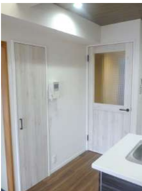
[専用部・室内写真][その他内観]☆建具取替えています☆