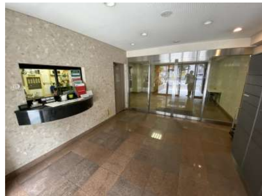
[共用部・設備施設][エントランスホール]