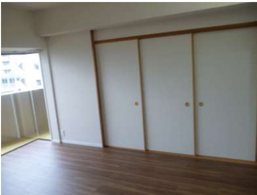
[専用部・室内写真][リビングダイニング] ☆和室との襖を閉めると ☆