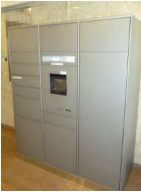
[共用部・設備施設][宅配ボックス]☆便利な宅配ボックスです☆