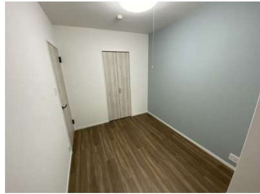
[専用部・室内写真]