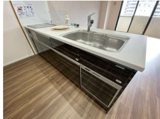
[専用部・室内写真][キッチン]