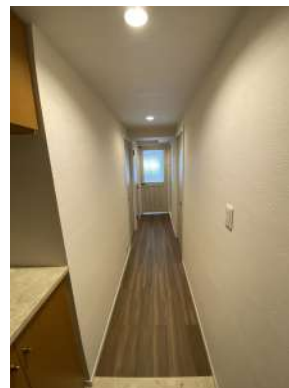
[専用部・室内写真]