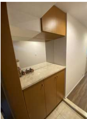
[専用部・室内写真][玄関]