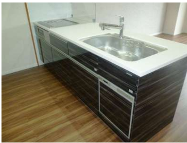
[専用部・室内写真][キッチン]☆対面システムキッチン☆