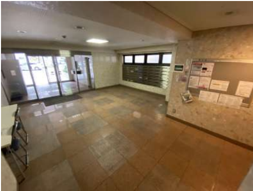
[共用部・設備施設][エントランスホール]