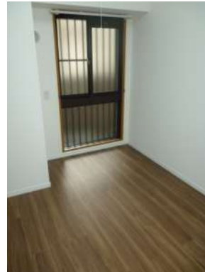
[専用部・室内写真][洋室]☆通風性良好☆