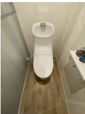
[専用部・室内写真][トイレ]☆ピカピカなトイレ☆