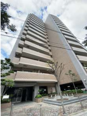
[外観・現況][外観写真]☆建物の温かい色合いが周辺風景とやさしく溶け合っています☆