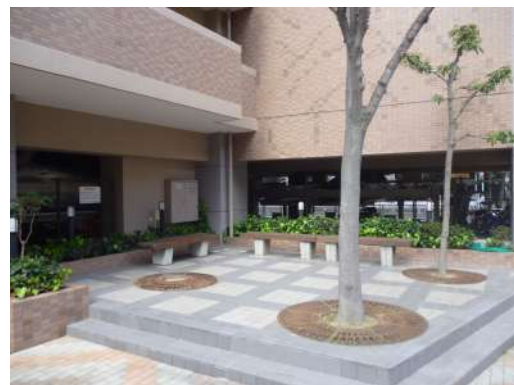
[共用部・設備施設][中庭] ☆緑のあるアプローチです ☆