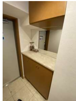
[専用部・室内写真][玄関]