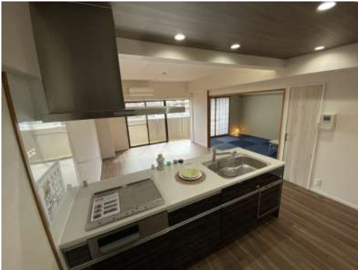
[専用部・室内写真][ダイニングキッチン]