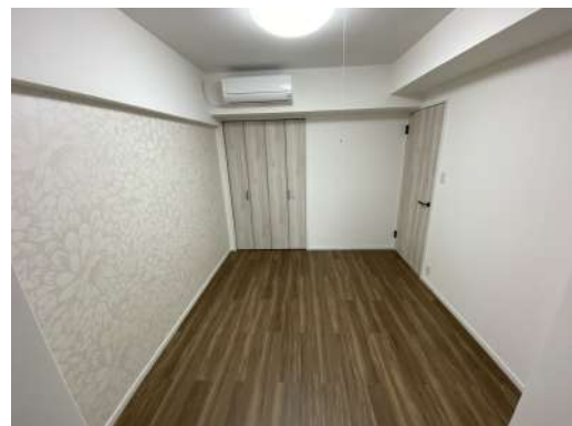
[専用部・室内写真][洋室]