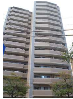
[外観・現況][外観写真]☆建物の温かい色合いが周辺風景とやさしく溶け合っています☆