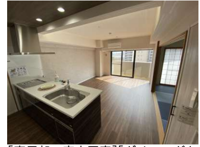
[専用部・室内写真][ダイニングキッチン]