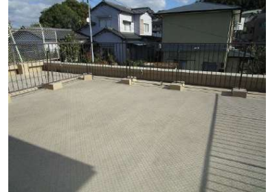
[専用部・室内写真][バルコニー]約44㎡のルーフバルコニー