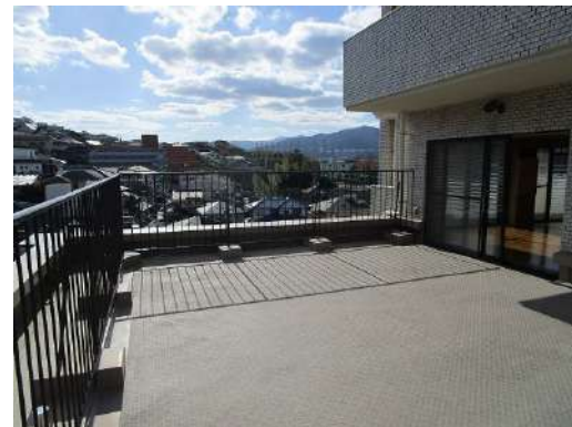
[専用部・室内写真][バルコニー]