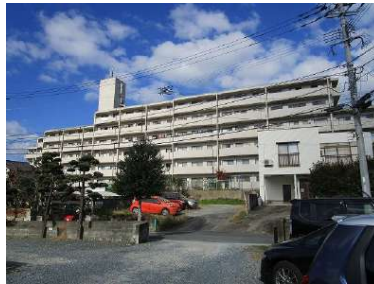
[外観・現況][外観写真]