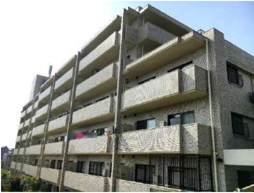
[外観・現況][外観写真]南東角部屋！