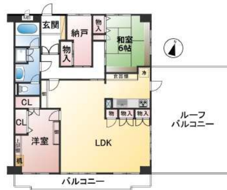
[間取り図・図面][間取り図]