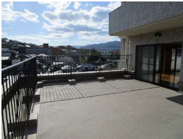
[専用部・室内写真][バルコニー]