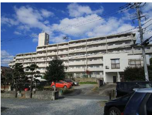
[外観・現況][外観写真]