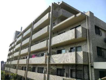
[外観・現況][外観写真]南東角部屋!