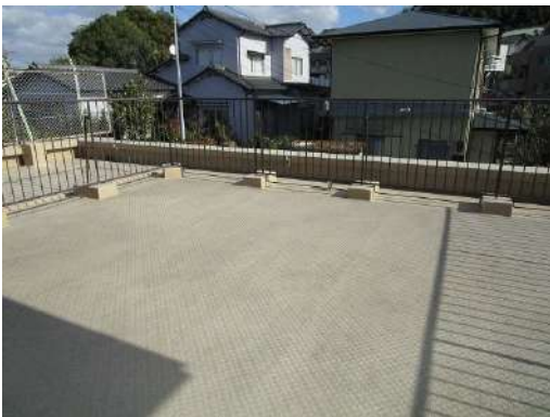
[専用部・室内写真][バルコニー]約44㎡のルーフバルコニー