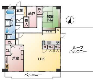
[間取り図・図面][間取り図]