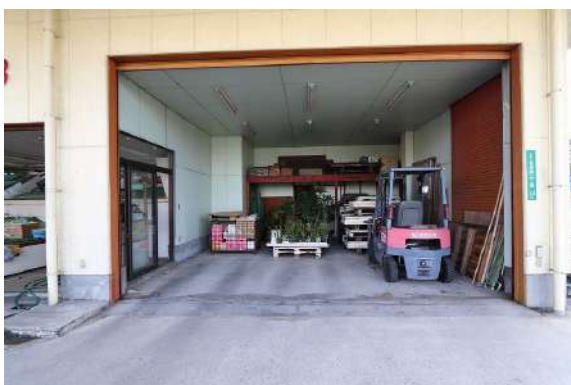
[外観・現況][現況外観写真]