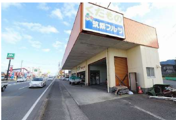
[外観・現況][現況外観写真]