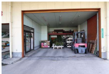
[外観・現況][現況外観写真]