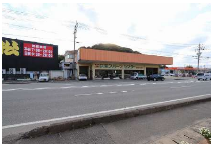
[外観・現況][現況外観写真]