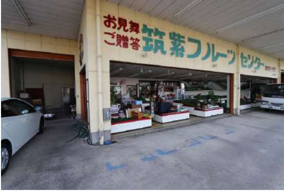
[外観・現況][現況外観写真]