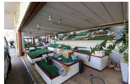
[外観・現況][現況外観写真]