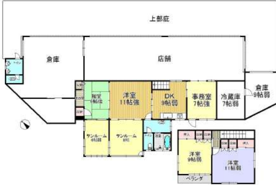
[間取り図・図面][間取り図]