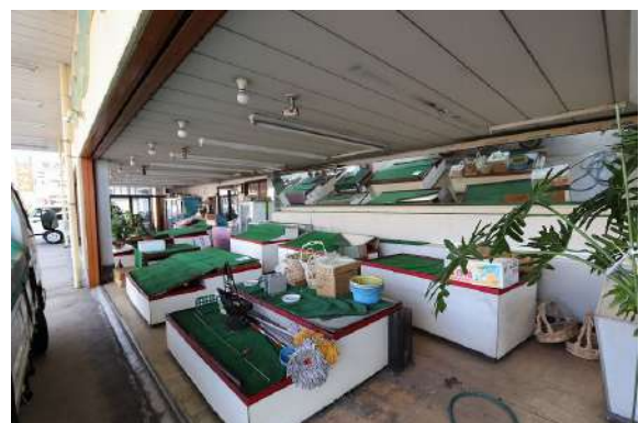
[外観・現況][現況外観写真]