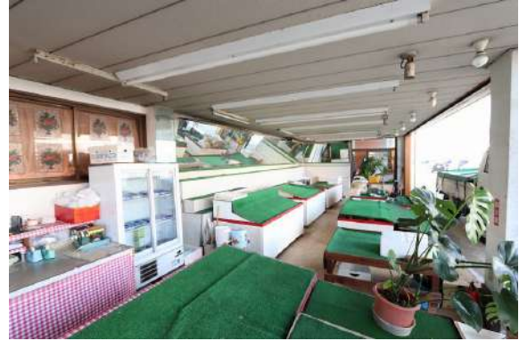
[外観・現況][現況外観写真]