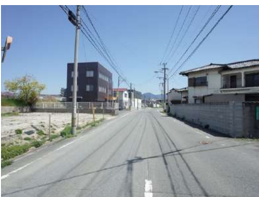
[外観・現況][前面道路含む現地写真]前面道路を西から東へ撮影