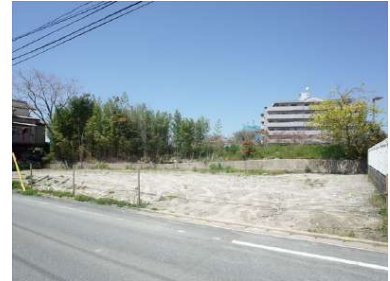
[外観・現況][前面道路含む現地写真]敷地北西側から撮影