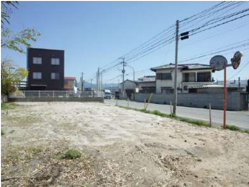
[外観・現況][現況写真]北西方向から撮影。