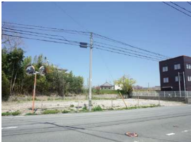
[外観・現況][前面道路含む現地写真]対象物件正面から撮影