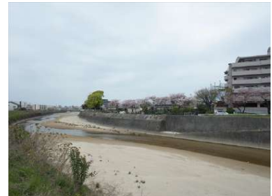
[外観・現況]北側土手の上から宇美川を望む。