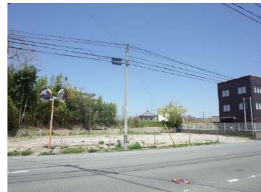
[外観・現況][前面道路含む現地写真]対象物件正面から撮影