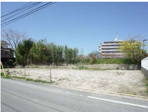
[外観・現況][前面道路含む現地写真]敷地北西側から撮影