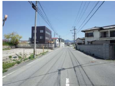
[外観・現況][前面道路含む現地写真]前面道路を西から東へ撮影