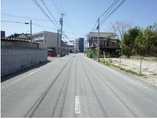
[外観・現況][現況写真]前面道路を東から西へ撮影