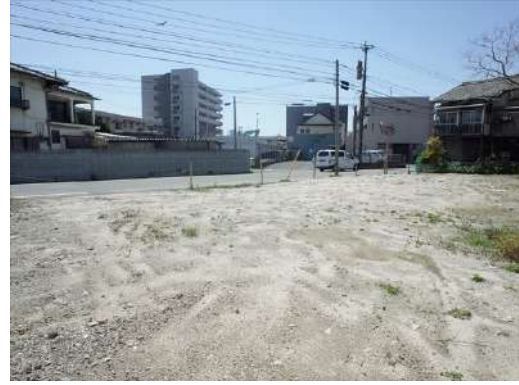
[外観・現況][現況写真]敷地北東側から撮影