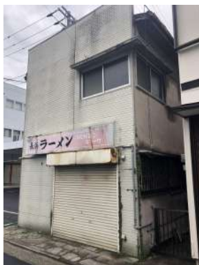
[外観・現況][現況写真]