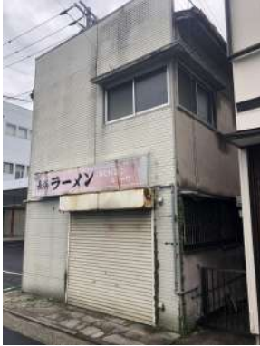
[外観・現況][現況写真]