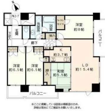
専有面積100平米超のゆとりのある間取りです