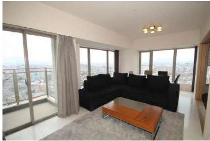
窓の外に広がるパノラマビュー！