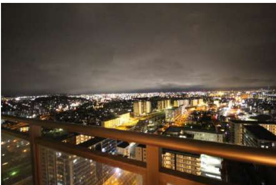
夜景もまた魅力的です！