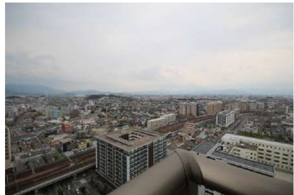
バルコニーより。眺望良好！