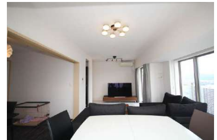
リビングダイニング(約15.4帖)