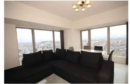
二面採光の明るいリビングです