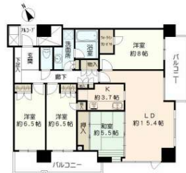
専有面積100平米超のゆとりのある間取りです