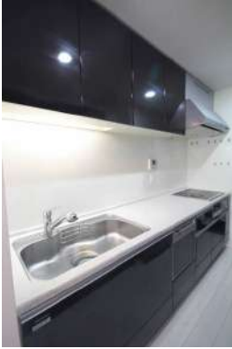
約3.7帖の独立キッチン♪