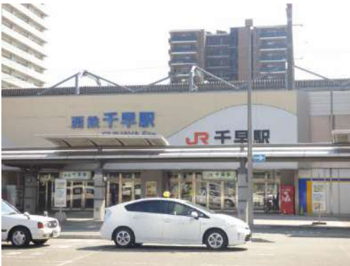
千早駅まで徒歩2分!