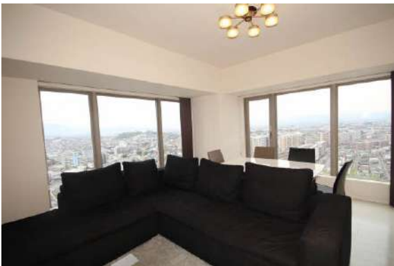
二面採光の明るいリビングです