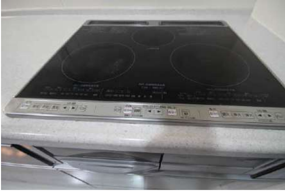
I Hクッキングヒーター