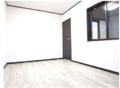
南西側6帖洋室です。和室を洋室に変更しました。