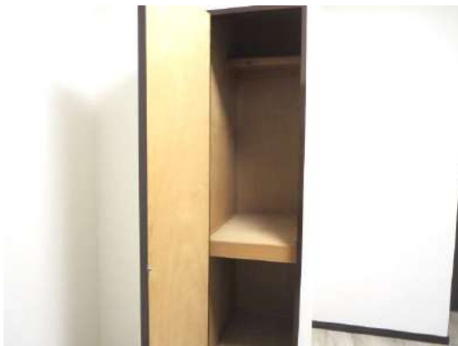
東側4.9帖洋室の物入です。小さいですが棚付きの収納です。