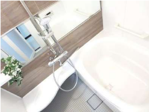
浴室はリクシル製ユニットバスに新品交換しました。