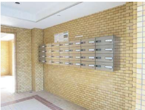
棟内の集合ポスト写真です。プッシュ式暗唱番号になっています。