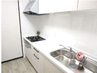
新品ハウステック製のシステムキッチンに変更しております。