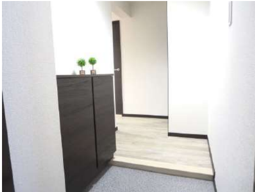
玄関ホールの、フロアタイル床・天井・壁クロス張り替えました。