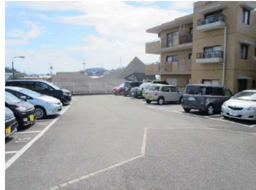
棟内駐車場空きありませんが必要な方は近隣駐車場をお探しします