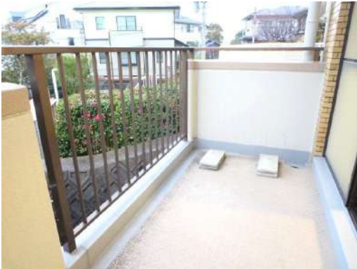
バルコニー写真です。南西向きで日当たり良好です。