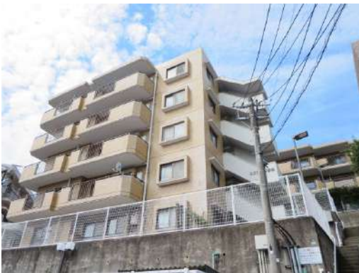
総戸数27戸5階建て3階部分になります。