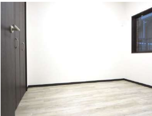
北側5帖洋室です。大容量の収納があり扉は新品の交換しました。