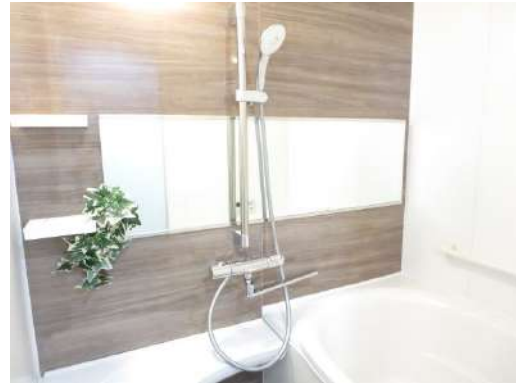
シャワーはスライドバーで高さ調整が自在に出来ます。