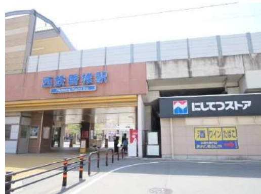
スーパー「にしてつストア」様まで徒歩10分(750M)です。