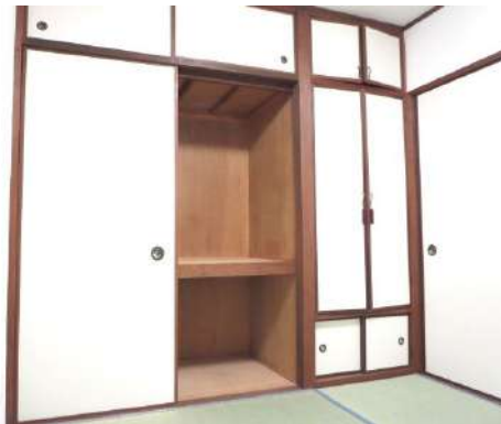
西側4.5畳和室の押入れの様子です。