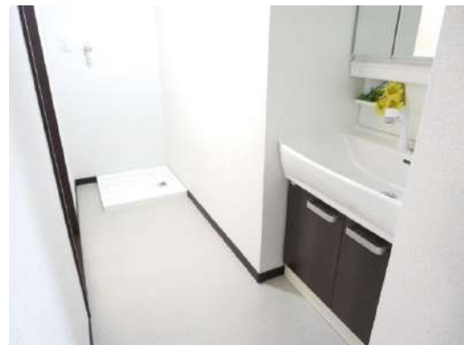
洗面脱衣所の床は、クッションフロアー床張り替え。