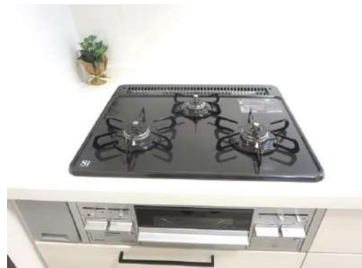
コンロ。ホーロートップ幅600mm。プッシュ&レバー式点火。