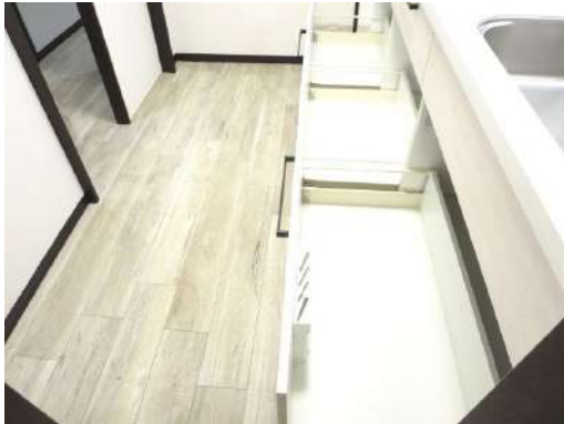
ハウステック製の収納部分は引き出し式です。