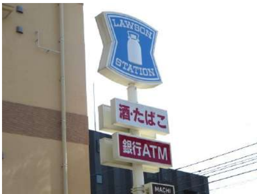
「ローソン」様まで徒歩10分(800M)です。