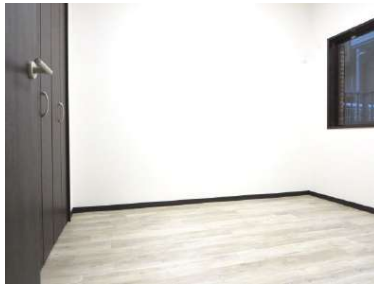
北側5帖洋室です。大容量の収納があり扉は新品の交換しました。