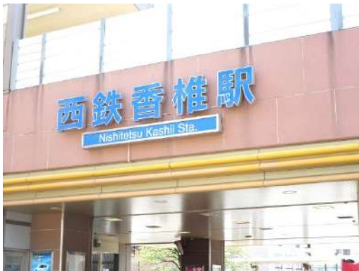
西鉄貝塚線「香椎駅」駅まで徒歩10分(750M)です。