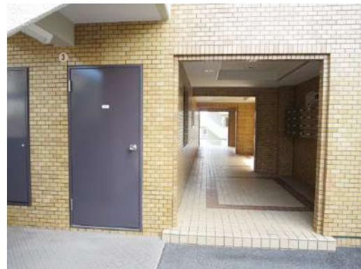
建物入口は3か所あり、オートロックではありません。