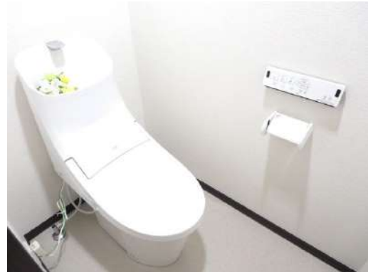
TOTO製新品の便器・便座に交換しました。