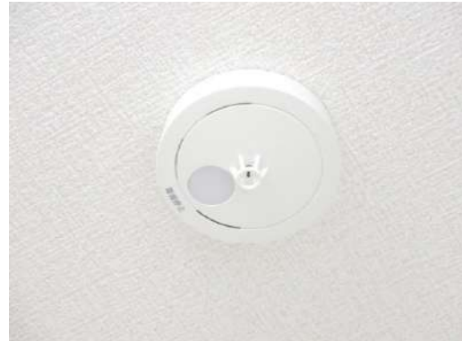
全居室に火災警報器を設置。