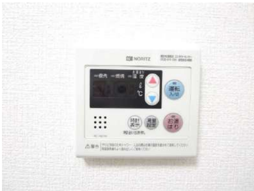
NORITZ製の都市ガス仕様のガス給湯器も新品に交換しました