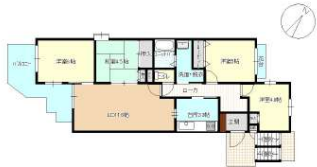
[間取り図・図面][間取り図]リフォーム後(予定)の間取り図です。