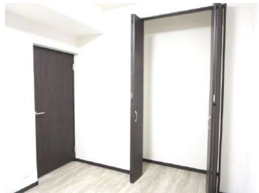
帖洋室のクローゼットは、扉を新しく交換しました。