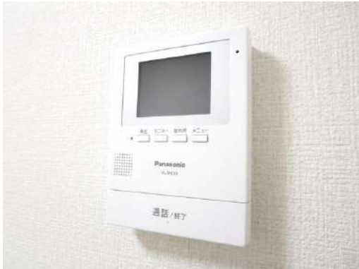
パナソニック製新品インターフォンのモニターを取付ました。