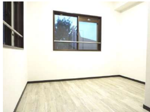
東側4.9帖洋室です。2面採光の明るい部屋です。