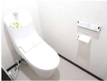
TOTO製新品の便器・便座に交換しました。