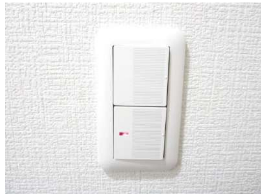
照明スイッチは全てワイドタイプに交換しました。