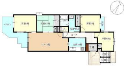
[間取り図・図面][間取り図]リフォーム後(予定)の間取り図です。