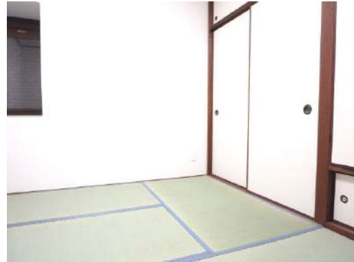
西側4.5畳の和室です。和室があると急なお客様も安心ですね。