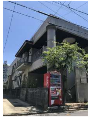
[外観・現況][現況外観写真]