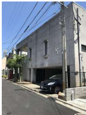
[外観・現況][外観写真]