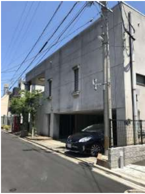
[外観・現況][外観写真]