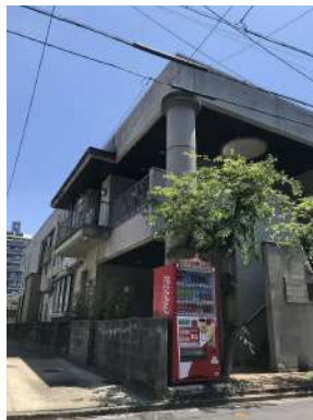
[外観・現況][現況外観写真]