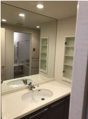
[専用部・室内写真][洗面化粧台]