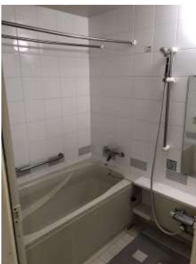
[専用部・室内写真][浴室]