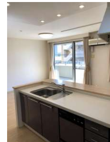
[専用部・室内写真][キッチン]