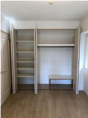
[専用部・室内写真][収納]