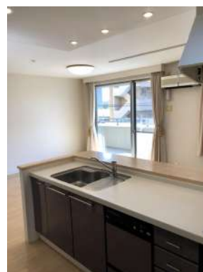
[専用部・室内写真][キッチン]