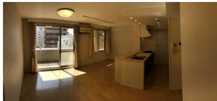
[専用部・室内写真][リビングダイニング]