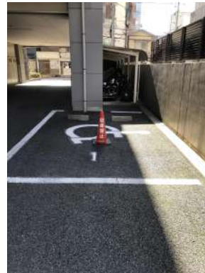
[共用部・設備施設][駐車場]