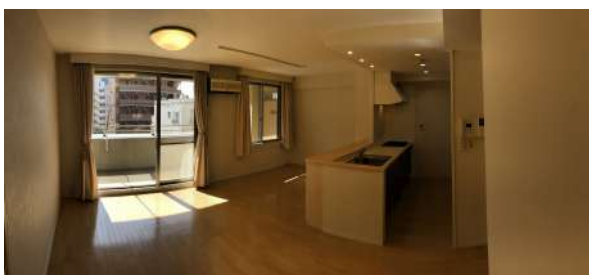
[専用部・室内写真][リビングダイニング]