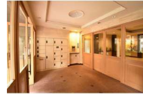
[共用部・設備施設][宅配ボックス]