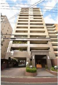
[外観・現況][外観写真]