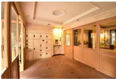
[共用部・設備施設][宅配ボックス]