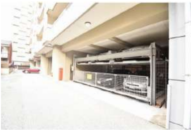
[共用部・設備施設][駐車場]