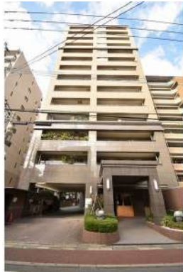
[外観・現況][外観写真]