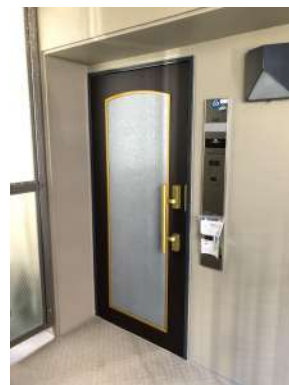
[共用部・設備施設][玄関]