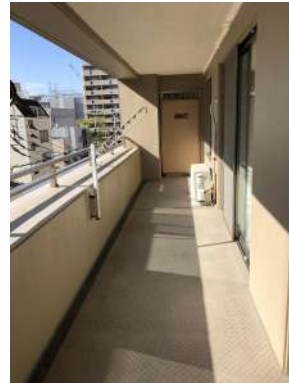
[専用部・室内写真][バルコニー]