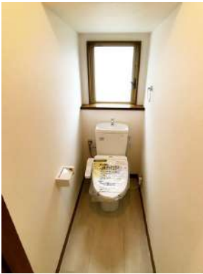
「トイレ」ウォシュレット付きトイレに交換済みです。