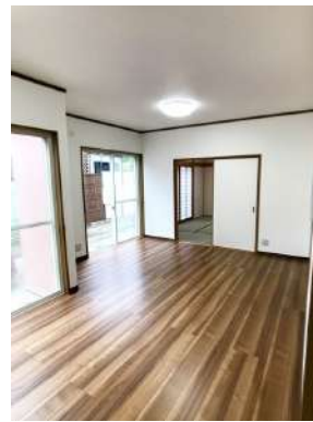
「リビング」和室と続いていますので使い勝手が良いですよ。