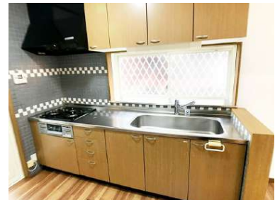
「キッチン」食器棚などを置いても余裕があります。