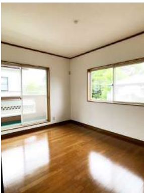
「2階洋室」各部屋に収納があります。