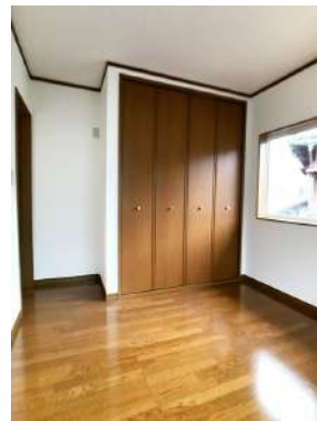
「2階洋室」背の高いクローゼットは助かります。