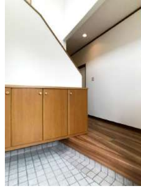
「玄関」吹き抜けがあるので開放感があります。