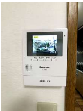
「設備」モニター付きインターフォンに交換しています。