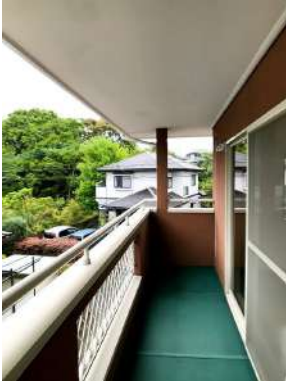
「バルコニー」多少の雨でも安心できる深さです。