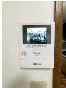
「設備」モニター付きインターフォンに交換しています。