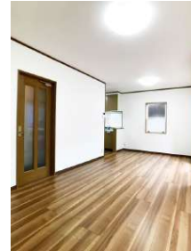
「リビング」建具と色調を合わせた床材を張っています。