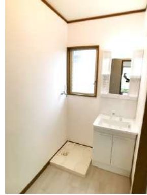
「洗面台」シャワー付き洗面台に交換済みです。