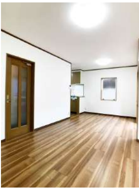
「リビング」建具と色調を合わせた床材を張っています。