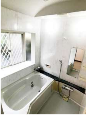
「浴室」ゆったり入れる広さです。