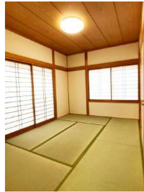
「和室」井草の香りが気持ちいい和室です