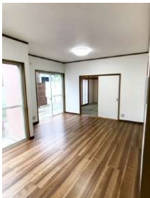
「リビング」和室と続いていますので使い勝手が良いですよ。