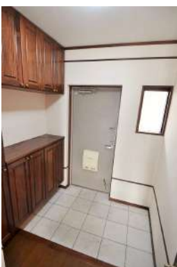
[専用部・室内写真][玄関]玄関土間が広めでみんなでお出かけの際もスムーズです！