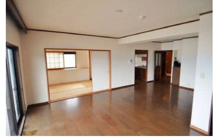
[専用部・室内写真][ダイニング]約21帖の開放的なりビングダイニング！！