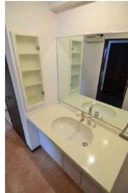
[専用部・室内写真][洗面化粧台]鏡が大きいのでお子様と並んで準備ができます♪