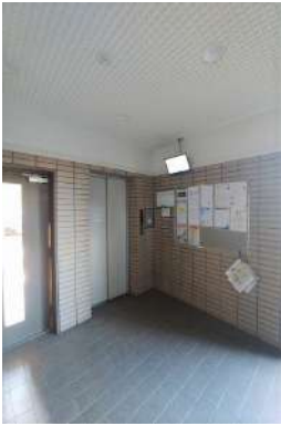
[共用部・設備施設][その他共用部]エレベーター付きで重い荷物も楽に運べます！