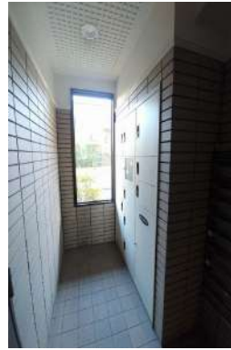
[共用部・設備施設][宅配ボックス]便利な宅配ボックス付きでいつでも荷物を受け取れます！