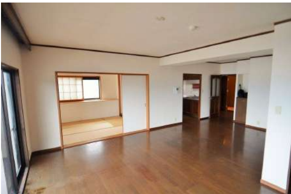
[専用部・室内写真][ダイニング]約21帖の開放的なリビングダイニング！！