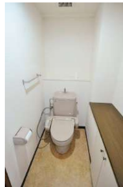
[専用部・室内写真][トイレ]トイレにも便利な収納棚があります！