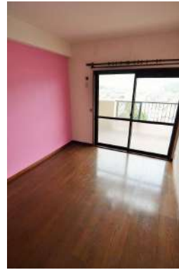
[専用部・室内写真][洋室]