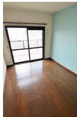
[専用部・室内写真][洋室]子供部屋にも最適です！