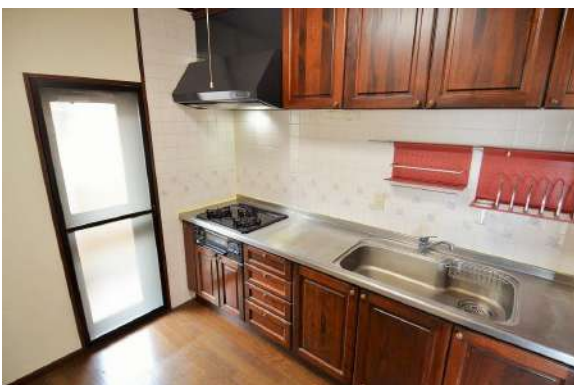
[専用部・室内写真][キッチン]収納豊富で調理器具や食品をすっきり片付けられます！