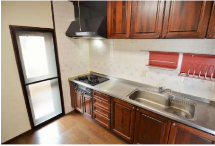
[専用部・室内写真][キッチン]収納豊富で調理器具や食品をすっきり片付けられます！