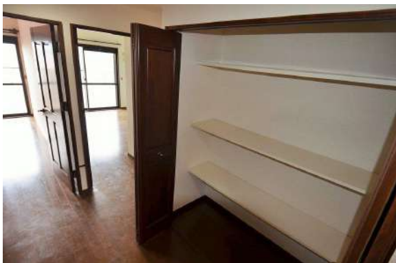
[専用部・室内写真][収納]大きな収納があり日用品のストック等にも便利！