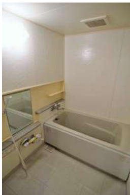
[専用部・室内写真][浴室]一日の疲れを癒すバスルーム！