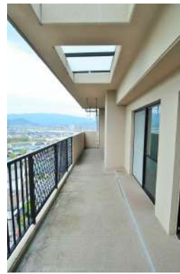
[専用部・室内写真][バルコニー]広めのバルコニーで家族の洗濯物やお布団がたくさん干せます！