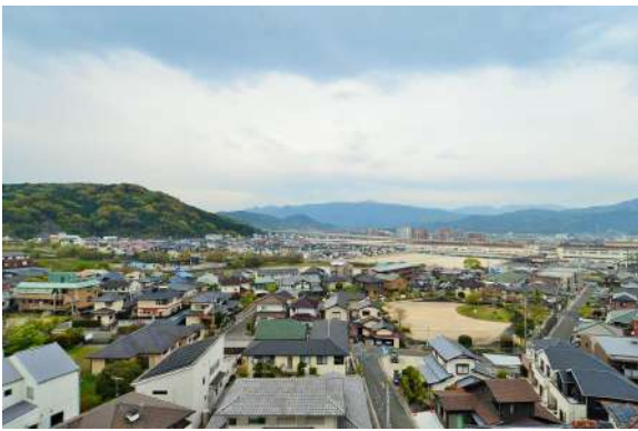
[専用部・室内写真][眺望]最上階、バルコニーからの眺望です。