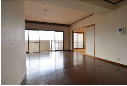
[専用部・室内写真][ダイニング]