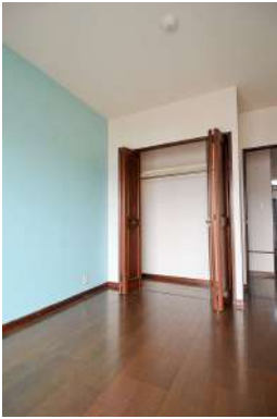
[専用部・室内写真][洋室]各居室収納完備！！