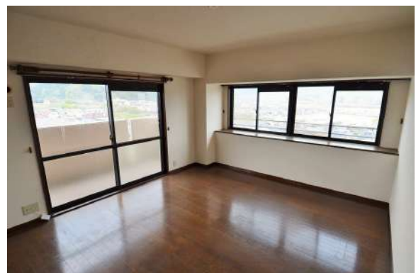
[専用部・室内写真][洋室]2面採光の明るい室内！