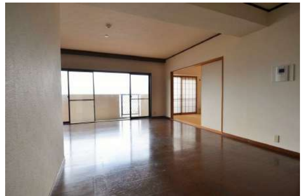
[専用部・室内写真][ダイニング]