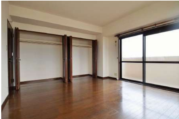
[専用部・室内写真][洋室]収納豊富でお部屋を広くお使いいただけます！