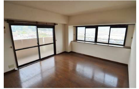
[専用部・室内写真][洋室]2面採光の明るい室内！