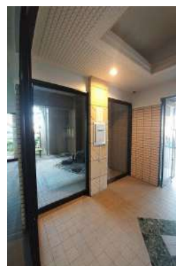
[共用部・設備施設][エントランスホール]オートロック付きでセキュリティも安心！