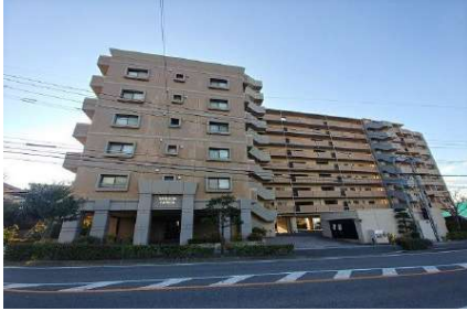
[外観・現況][外観写真]