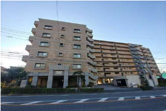
[外観・現況][外観写真]