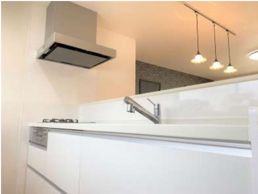
リビングの見渡せる対面式キッチンです♪