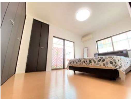
室内丁寧にお使いです♪