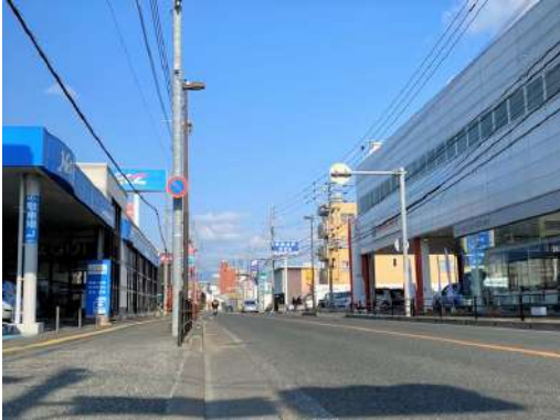
前面道路写真です♪