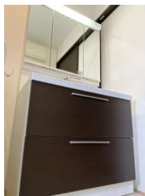
収納豊富な三面鏡の洗面台です♪