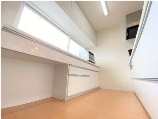
嬉しいカップボード付きのキッチンです♪