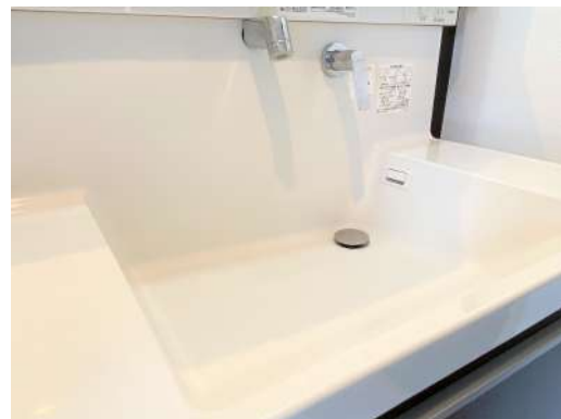
お掃除のしやすい洗面台です♪