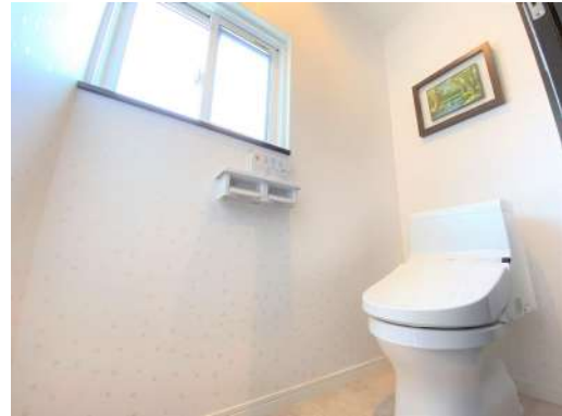
窓付の明るいお手洗いです♪