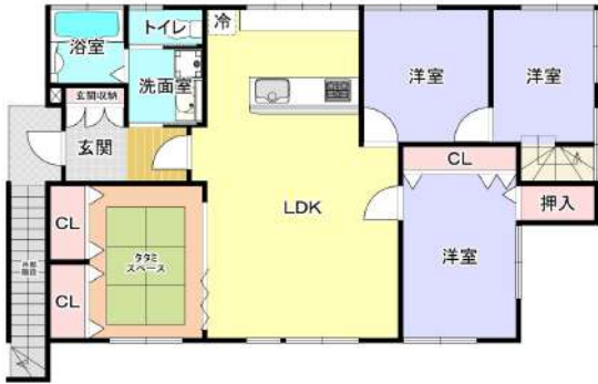
4LDK平成26年リフォーム済みの美邸です！