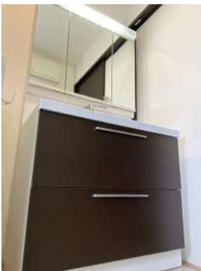
収納豊富な三面鏡の洗面台です♪