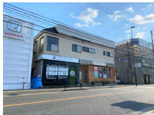
幹線道路沿いの便利な立地です♪