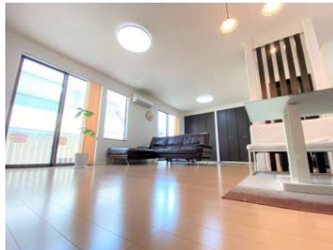
広々としたLDKです。大きな窓がついており開放的です♪