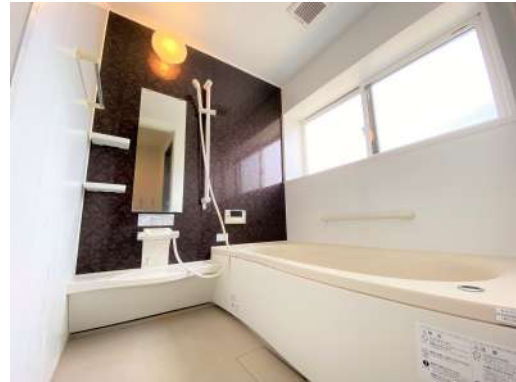
1坪サイズの広々とした浴室です♪