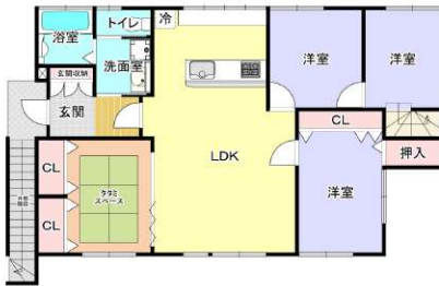
4LDK平成26年リフォーム済みの美邸です！