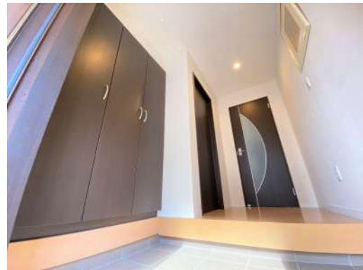
スッキリとした玄関ホールです♪