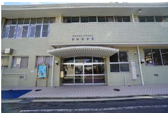
[その他][その他]西新保育園 徒歩約4分