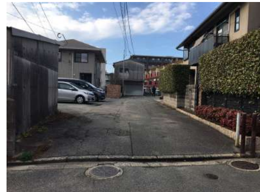
[外観・現況][現況写真]226番1 共有私道部分 (持分1/16)