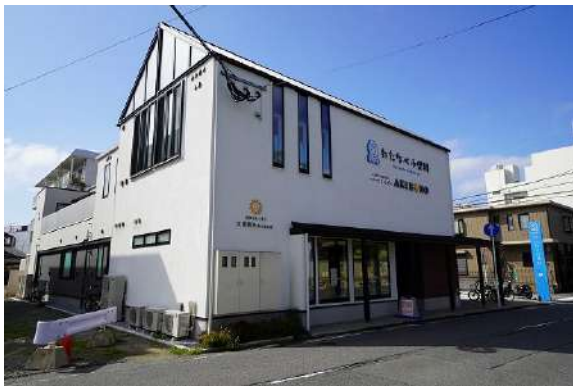
[その他][その他]わたなべ小児科 徒歩約3分