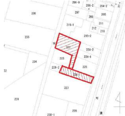
[間取り図・図面][区画図]222番、226番1 (持分1/16) が対象地になります。