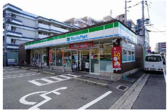
[その他][その他]ファミリーマート福岡あけぼの店 徒歩約2分