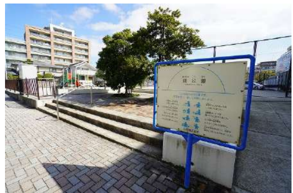
[その他][その他]曙公園 徒歩約4分