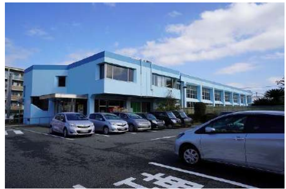
[その他][その他]早良市民プール 徒歩約3分