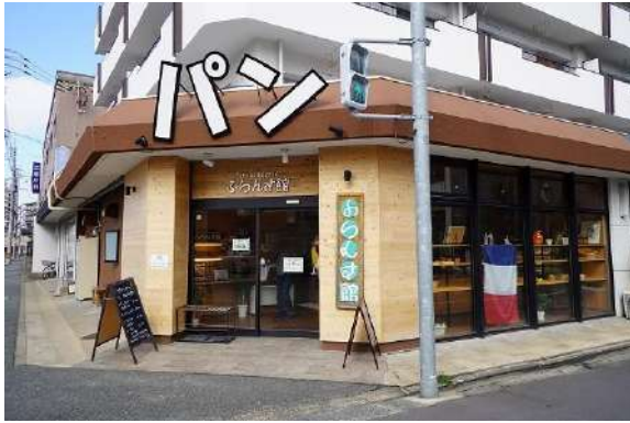
[その他][その他]ふらんす館 (パン屋) 徒歩約2分