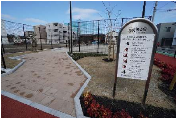
[その他][その他]鳥飼西公園 徒歩約3分