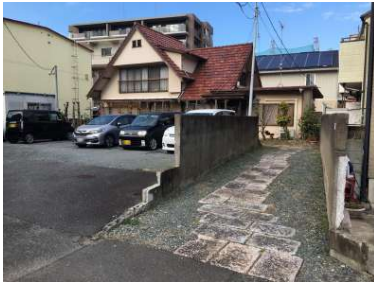
[外観・現況][現況写真]旗竿地になります。古家前面の敷地は月極駐車場になっています。