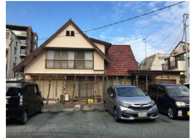
[外観・現況][現況写真]古家あり（昭和41年築）