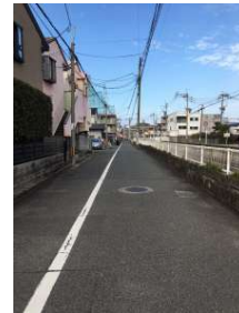
[その他][その他]東側公道（城西121号線）42条1項1号