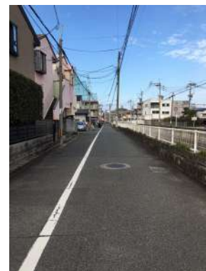
[その他][その他]東側公道 (城西121号線) 42条1項1号