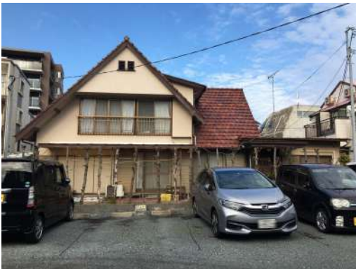
[外観・現況][現況写真]古家あり (昭和41年築)