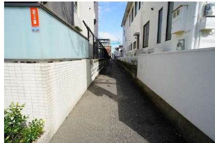
[その他][その他]西側（城西120号線）43条第2項第2号許可運用基準3-2