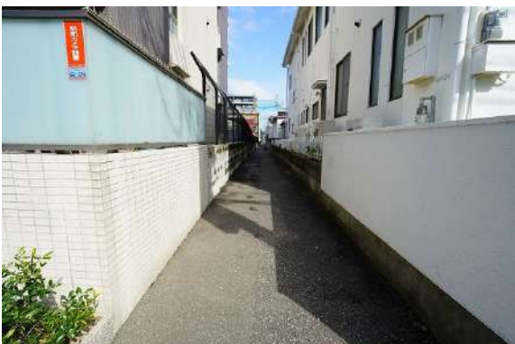
[その他][その他]西側 (城西120号線) 43条 第2項第2号許可運用基準3-2