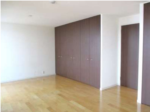
[専用部・室内写真][洋室]13.8帖