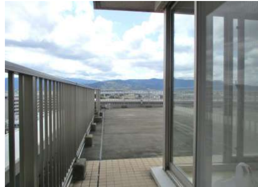
[専用部・室内写真][バルコニー]