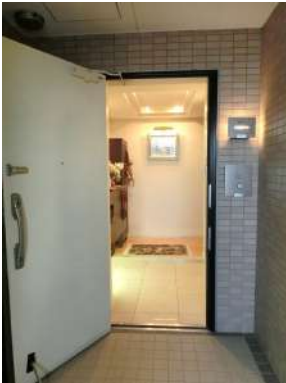
[専用部・室内写真][玄関]