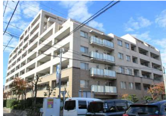
[外観・現況][外観写真]