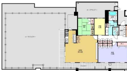
[間取り図・図面][間取り図]生活空間面積 293㎡