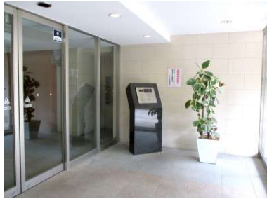
[共用部・設備施設][玄関]