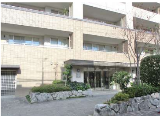
[共用部・設備施設][その他共用部]車付けできる玄関