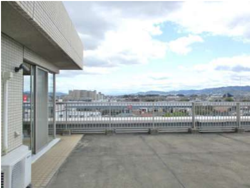
[専用部・室内写真][バルコニー]ルーフバルコニー