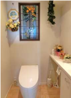
[専用部・室内写真][トイレ]