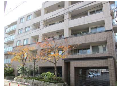
[共用部・設備施設][駐車場]車両出入り玄関（シャッターゲート）