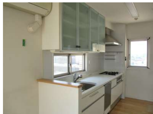
[専用部・室内写真][キッチン]