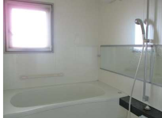
[専用部・室内写真][浴室]窓のある浴室