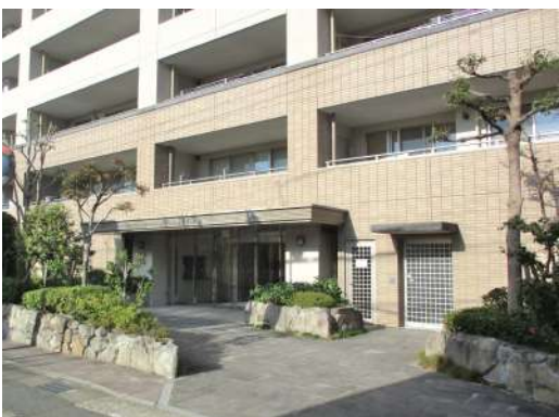
[共用部・設備施設][玄関]車付け玄関