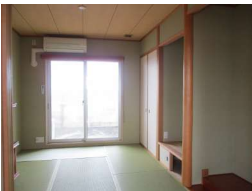
[専用部・室内写真][和室]