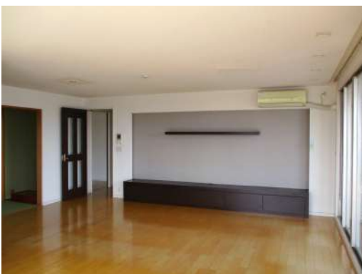
[専用部・室内写真][居間・リビング]