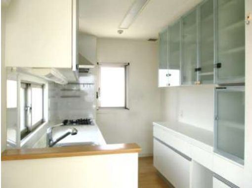
[専用部・室内写真][キッチン]カップボード・たっぷり収納