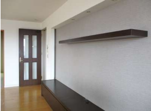
[専用部・室内写真][居間・リビング]