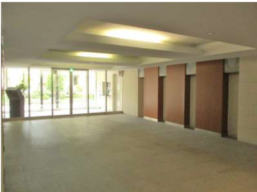
[共用部・設備施設][エントランスホール]