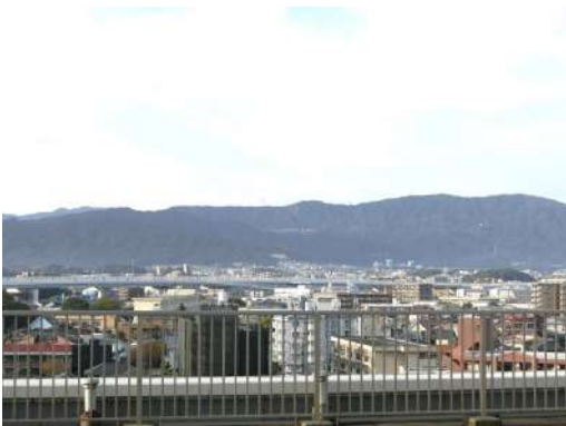
[専用部・室内写真][バルコニー]バルコニーからの景色