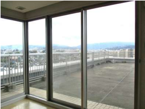
[専用部・室内写真][バルコニー]リビングからルーフバルコニー