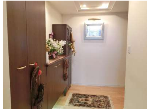
[専用部・室内写真][玄関]分譲時設計変更により玄関の広さを大きくしました。