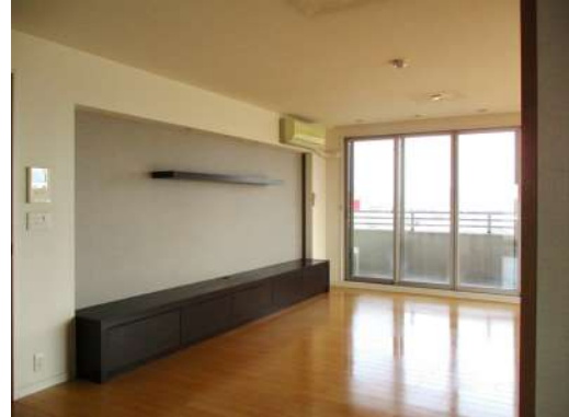
[専用部・室内写真][居間・リビング]