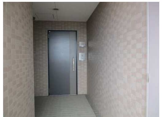
[専用部・室内写真][玄関]独立性の高いお部屋の玄関