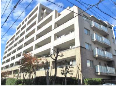
[外観・現況][外観写真]