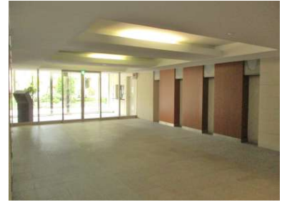
[共用部・設備施設][エントランスホール]