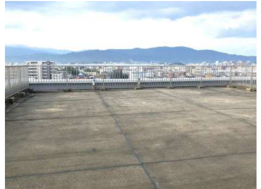
[専用部・室内写真][バルコニー]ルーフバルコニー (158.01㎡)