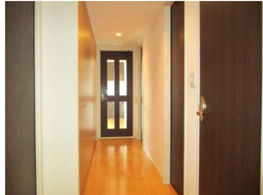
[専用部・室内写真][その他内観]