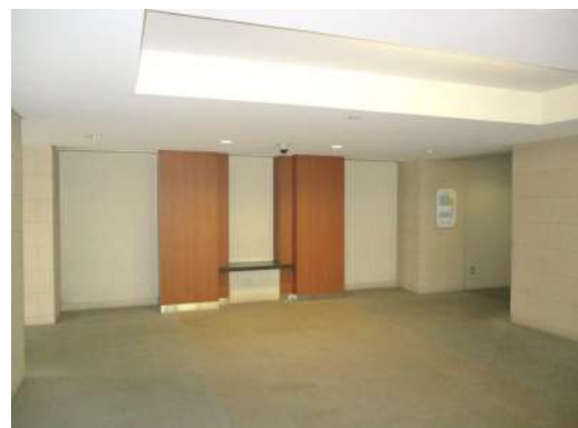
[共用部・設備施設][エントランスホール]