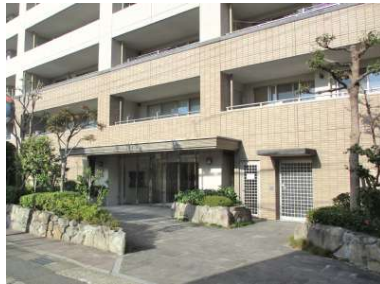
[共用部・設備施設][玄関]車付け玄関