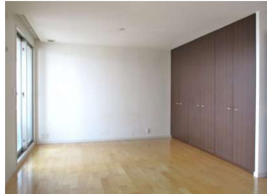
[専用部・室内写真][洋室]13.8帖