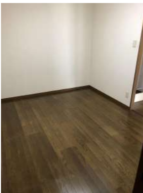
[専用部・室内写真][洋室]