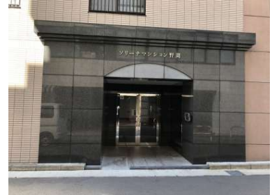
[外観・現況][エントランス（外）]