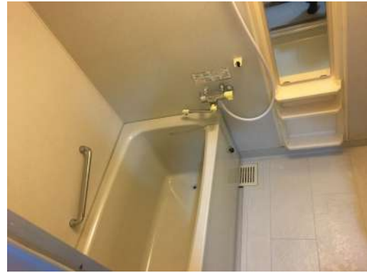
[専用部・室内写真][浴室]