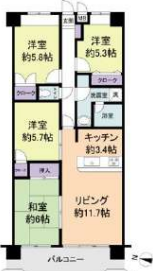
[間取り図・図面][間取り図]