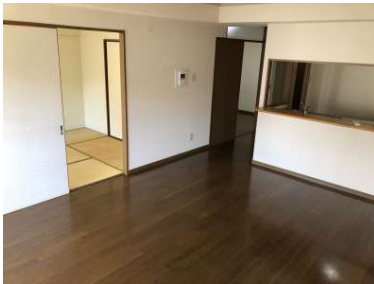
[専用部・室内写真][リビングダイニング]