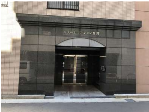
[外観・現況][エントランス（外）]