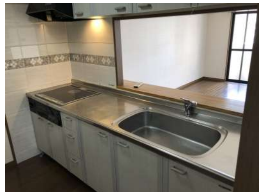
[専用部・室内写真][キッチン]