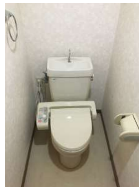
[専用部・室内写真][トイレ]