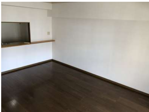
[専用部・室内写真][ダイニング]