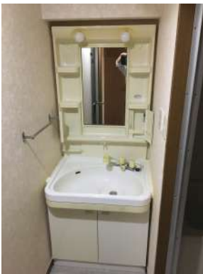
[専用部・室内写真][洗面化粧台]