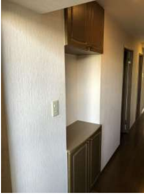
[専用部・室内写真][玄関]