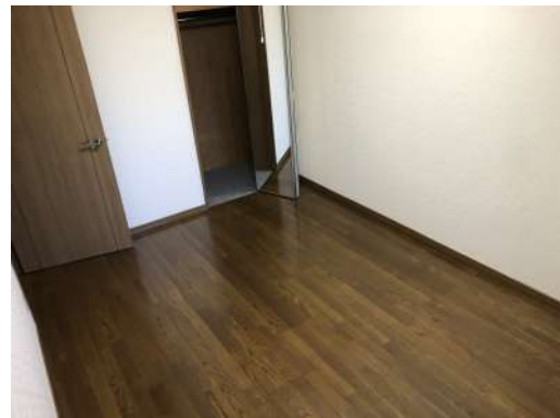
[専用部・室内写真][洋室]