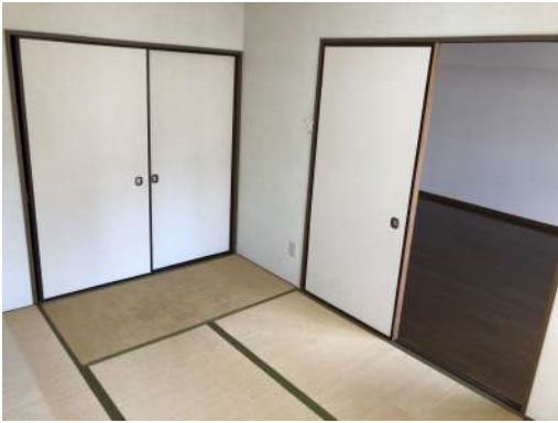
[専用部・室内写真][和室]