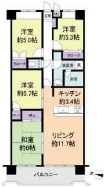
[間取り図・図面][間取り図]