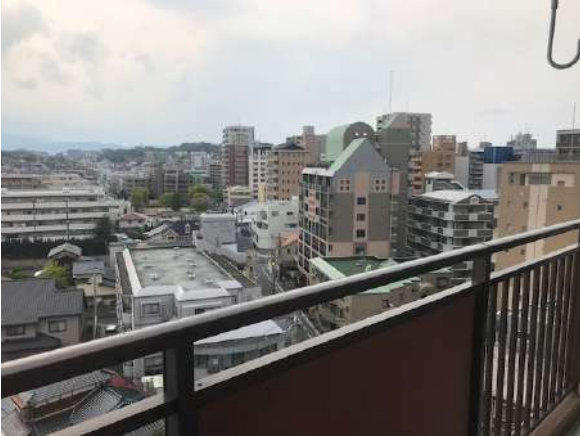
【眺望】9階からの眺めです