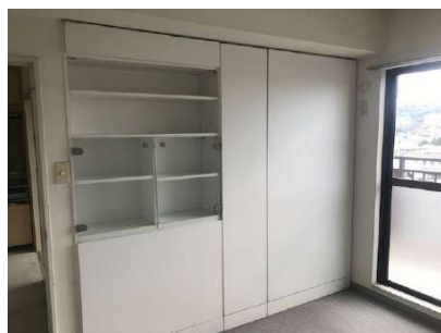
【洋室】右洋室 収納つき