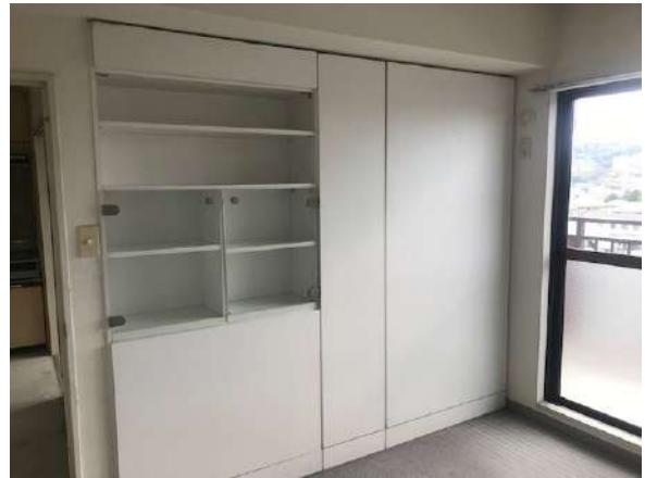
【洋室】右洋室 収納つき