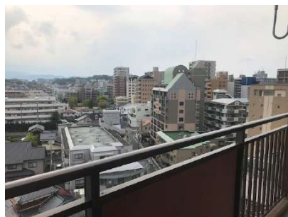
【眺望】9階からの眺めです