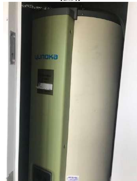
【発電・温水設備】電気温水器 玄関横です