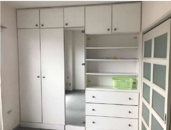
【洋室】左洋室 収納つき