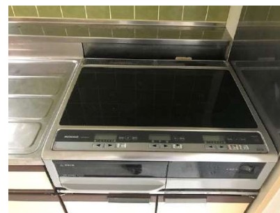
【キッチン】IHコンロ オール電化