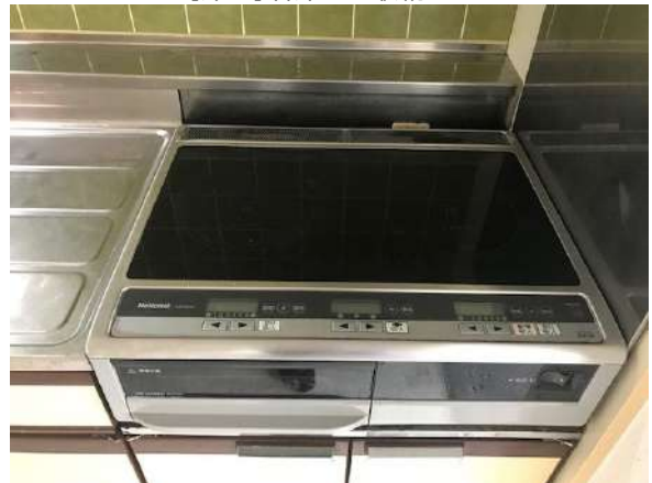
【キッチン】IHコンロ オール電化