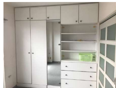
【洋室】左洋室 収納つき