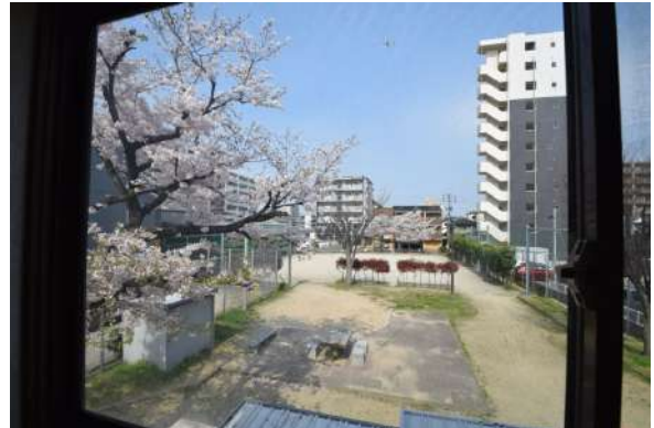
【眺望】二階東の窓から見える眺望。春には桜がキレイにみえます。