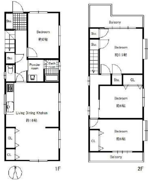
【間取り図】2階建て。4LDK。南向きの、日当たり良好な物件です。