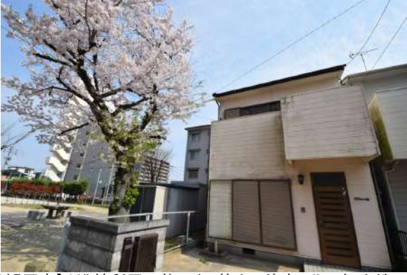
【外観写真】2沿線利用可能・バス停まで徒歩4分の好立地です。