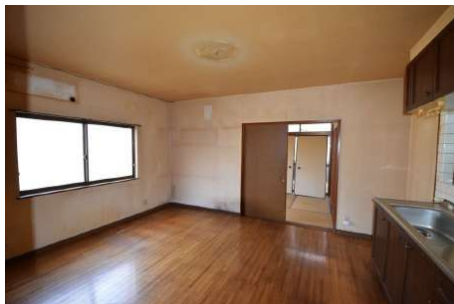
【ダイニングキッチン】写真正面の部屋とつなげて約16帖のLDKになる予定です。