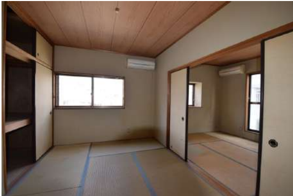
【洋室】こちらの部屋は現在和室ですが、リフォーム後、洋室予定です。