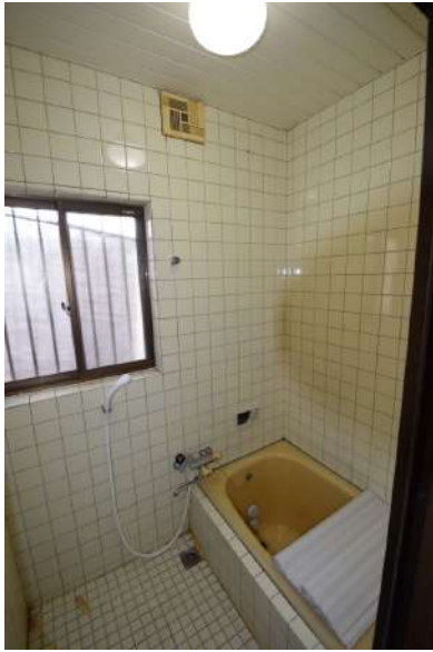
【浴室】浴室には窓があります。