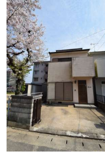
【外観写真】玄関前には車1台分の駐車場があります。