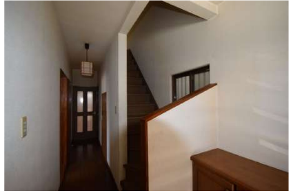
【その他内観】玄関から入ってすぐ右側に階段があります。