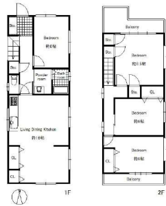
【間取り図】2階建て。4LDK。南向きの、日当たり良好な物件です。