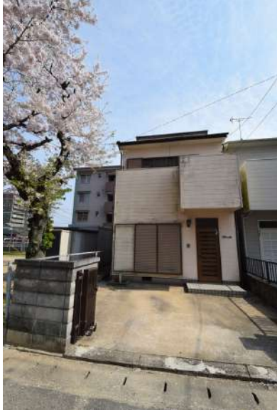
【外観写真】玄関前には車1台分の駐車場があります。