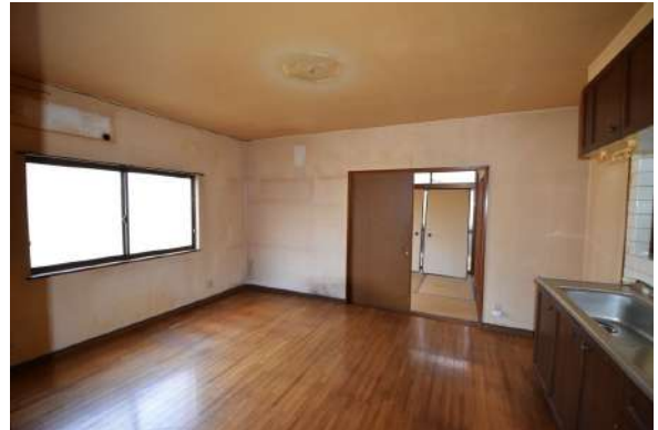
【ダイニングキッチン】写真正面の部屋とつなげて約16帖のLDKになる予定です。