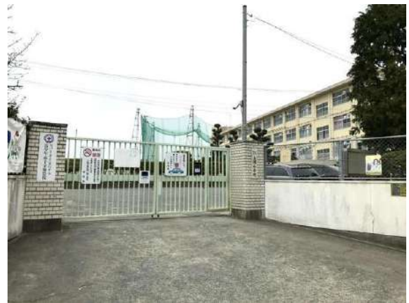
【その他】鳥飼小学校(約60m)