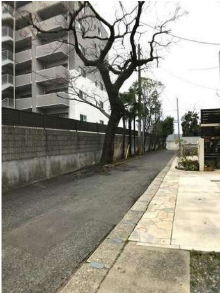
【前面道路含む現地写真】南側前面道路