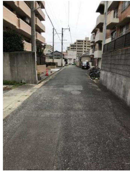
【前面道路含む現地写真】南側前面道路