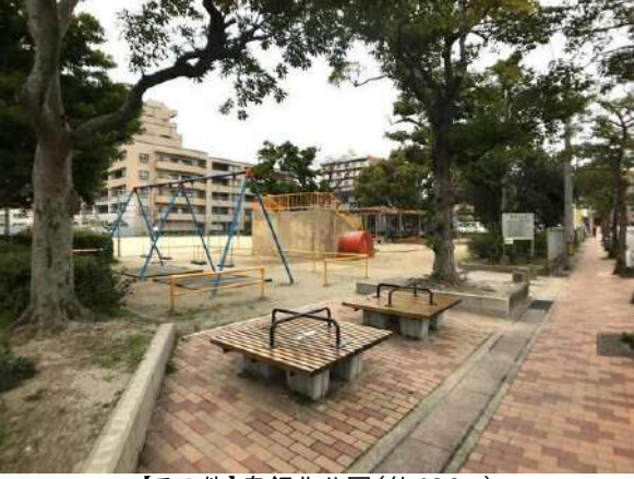
【その他】鳥飼北公園(約430m)