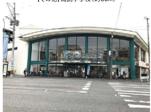
【その他】にしてつストアレガネット城西(約370m)