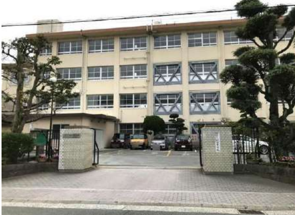
【その他】城西中学校(約320m)