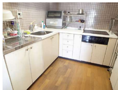
【キッチン】L型キッチンはお好みに入れ替えもいかもしれません。