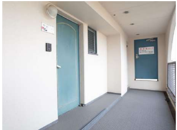
【その他共用部】広い共用廊下。行き止まりの角住戸です。