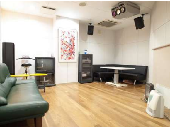
【その他設備】防音室があり、大きな音が出る楽器の演奏も可能です。(有料)