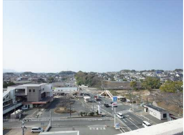
【眺望】南西側に東福間駅。目の前には高い建物がありません!