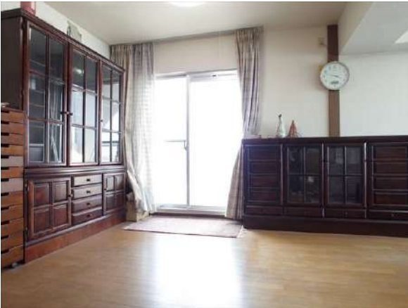
【居間・リビング】南側にも大きな掃き出しサッシ。前に高い建物がなく視線良好。