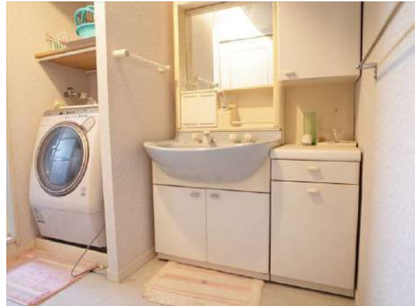
【脱衣場】トールタイプのキャビネットがついた洗面化粧台。