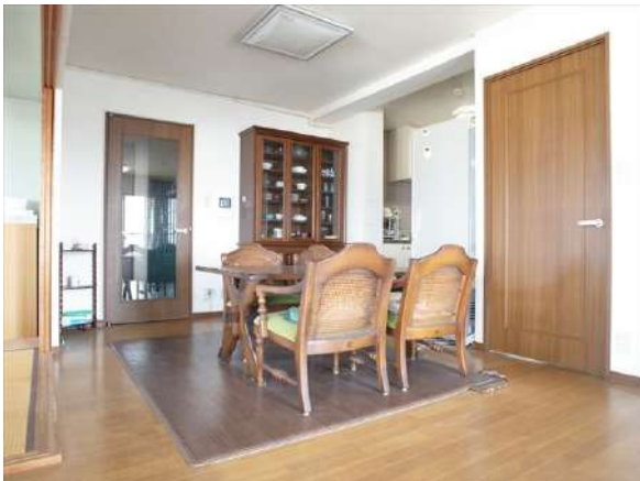
【居間・リビング】キッチン横には大きなダイニングセットも置けます。