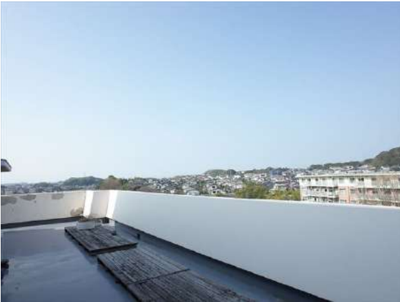
【バルコニー】約55㎡の広々ルーフバルコニー火気厳禁ですが、使い方は【バルコニー】ルーフバルコニーは室内を通らずに共用廊下から直接行き来可能!