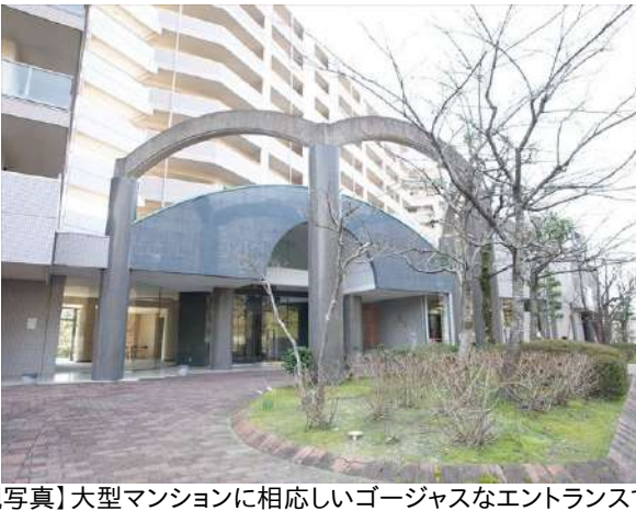
【外観写真】大型マンションに相応しいゴージャスなエントランスです♪