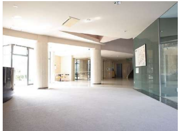
【その他共用部】一見無駄とも思えますが来訪者を気持ちよくお迎えする余白です。