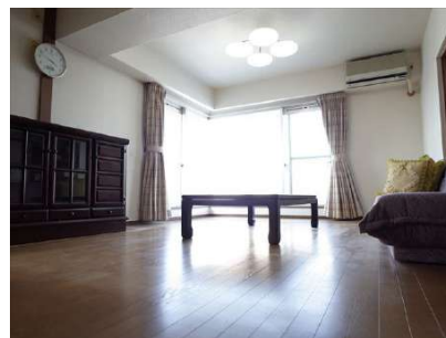
【居間・リビング】和室を開けると30帖です!