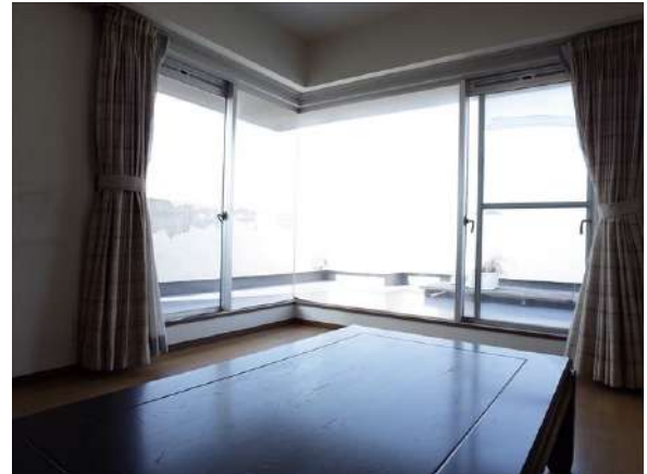
【居間・リビング】南西側に柱のない突き当てガラスの大きな開口。