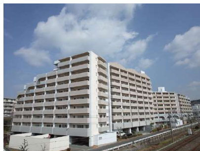
【外観写真】陰影がついた立体的な大きな建物は【間取り図】東福間のランドマークです♪