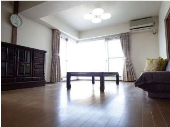
【居間・リビング】和室を開けると30帖です！