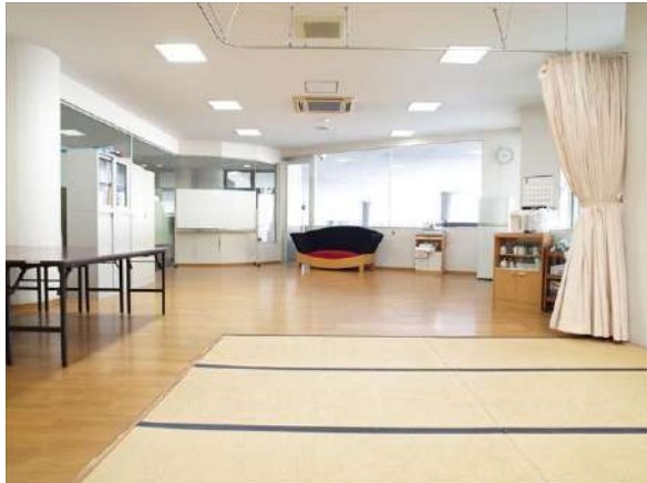
【その他共用部】集会所兼パーティールームがあります。