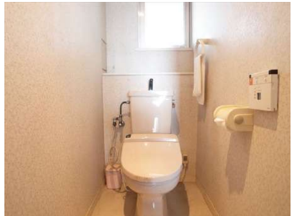
【トイレ】トイレにも窓有! 空気の入れ替えができるのはうれしいですね。