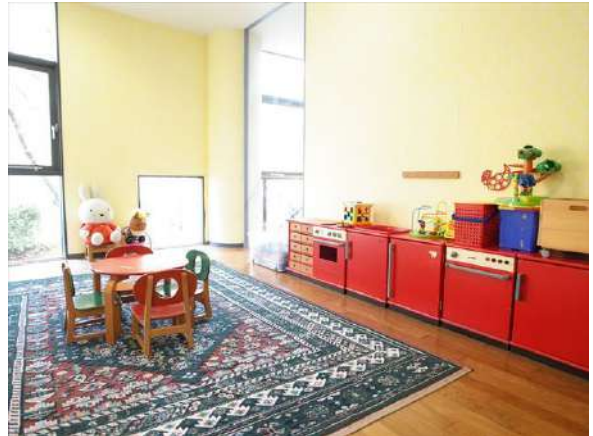
【その他共用部】キッズルーム完備♪