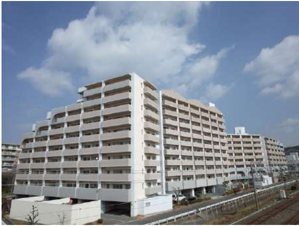
【外観写真】陰影がついた立体的な大きな建物は東福間のランドマークです♪