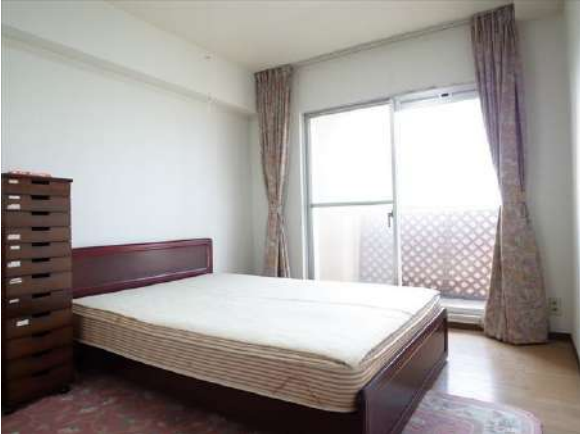
【寝室】シングルベッドを二つ並べて置くことも可能な広さです。