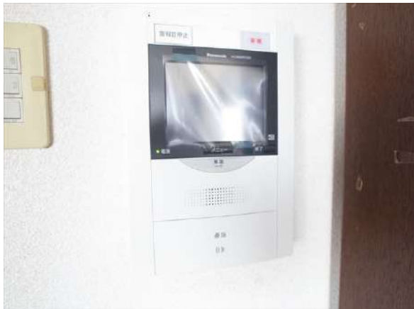
【TVモニタ付きインターフォン】モニター付インターフォンで来訪者を確認。