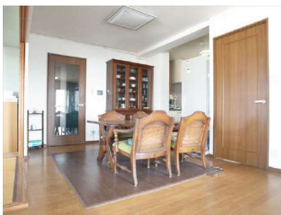
【居間・リビング】キッチンの横には大きなダイニングセットも置けます。