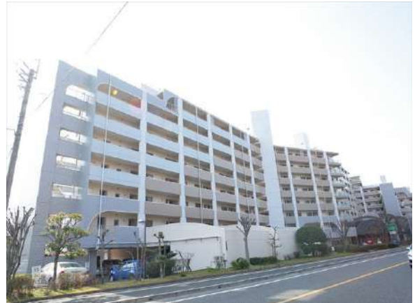
【外観写真】あえてクランクさせた建て方は建物の外観を引き締めます。