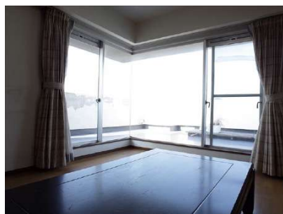
【居間・リビング】南西側に柱のない突き当てガラスの大きな開口。