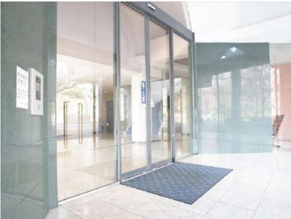
【エントランスホール】防犯設備のオートロックは、ロビー前とエレベーター前の2カ所!