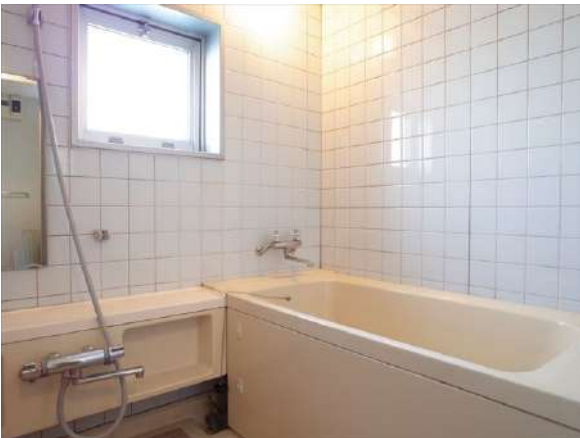
【浴室】明るい窓がついた浴室。窓の先はルーフバルコニーです。