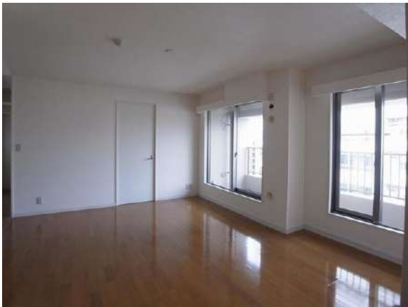
【リビングダイニング】