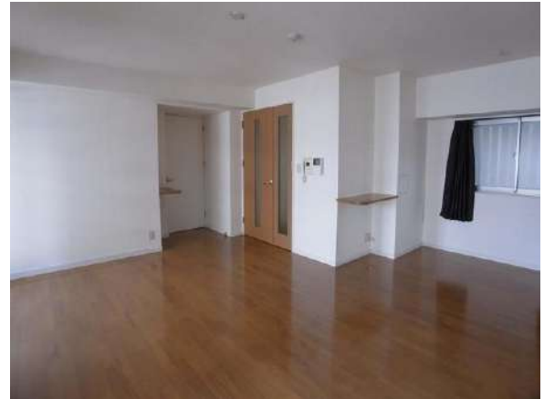
【リビングダイニング】