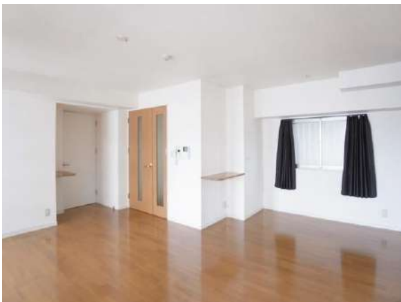
【リビングダイニング】