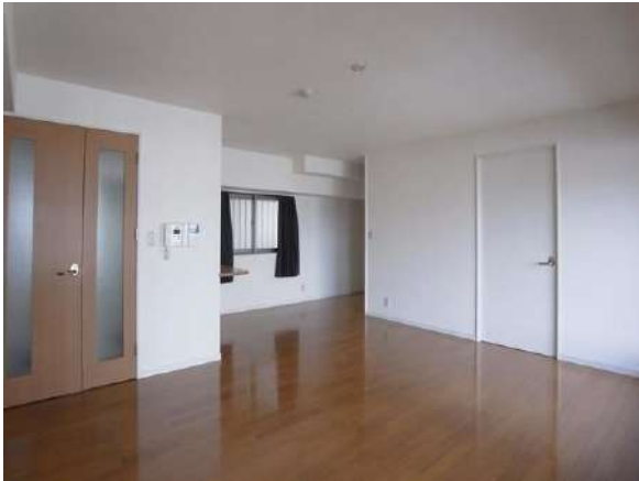
【リビングダイニング】