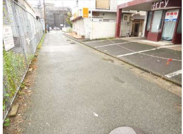
【前面道路含む現地写真】