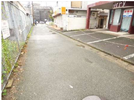
【前面道路含む現地写真】