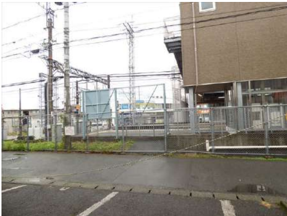
【前面道路含む現地写真】