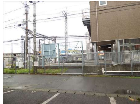
【前面道路含む現地写真】