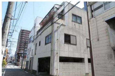
【外観写真】鉄骨3階建・2世帯向き【2DK+2K】