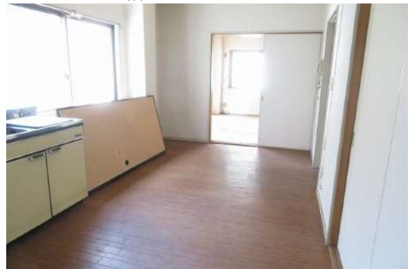
【ダイニングキッチン】2階のダイニングキッチンと奥が北側和室(2室とも角部屋)