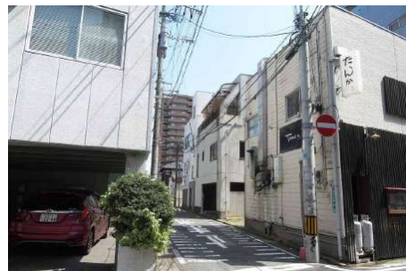
【現況外観写真】北側・市道4.5M。一方通行(東から西に)