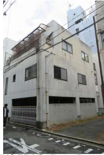
【外観写真】1階駐車場。2階2DK。3階2Kベランダ付き