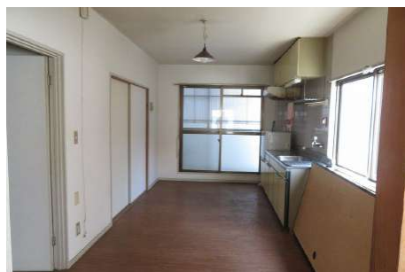
2階のダイニング・キッチン