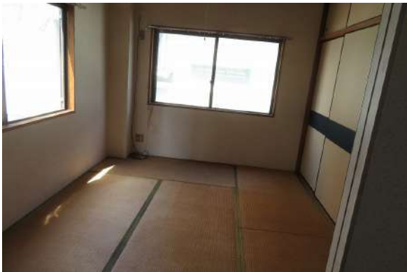
【和室】2階北側の6帖和室・押し入れ2間あり(角部屋)