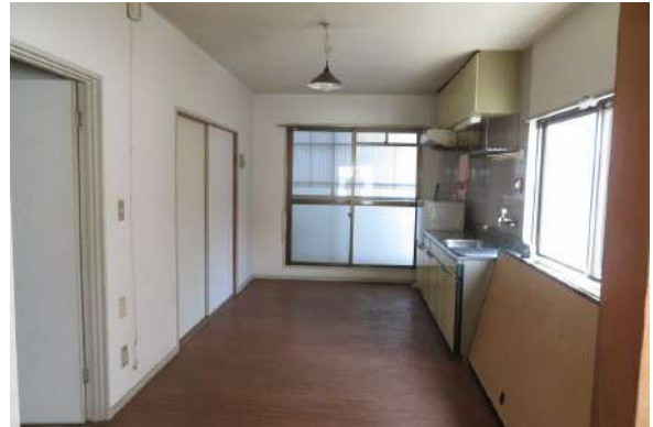
2階のダイニング・キッチン