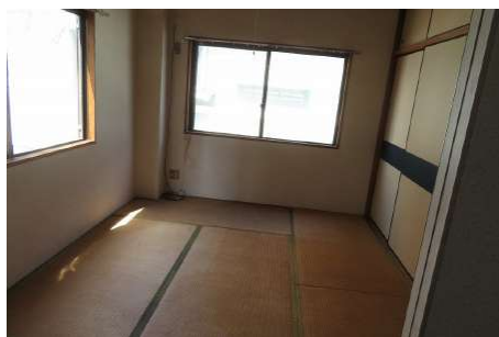
【和室】2階北側の6帖和室・押し入れ2間あり(角部屋)