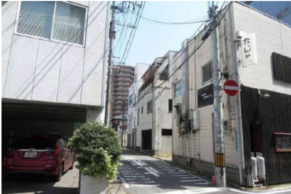
【現況外観写真】北側・市道4.5M。一方通行(東から西に)