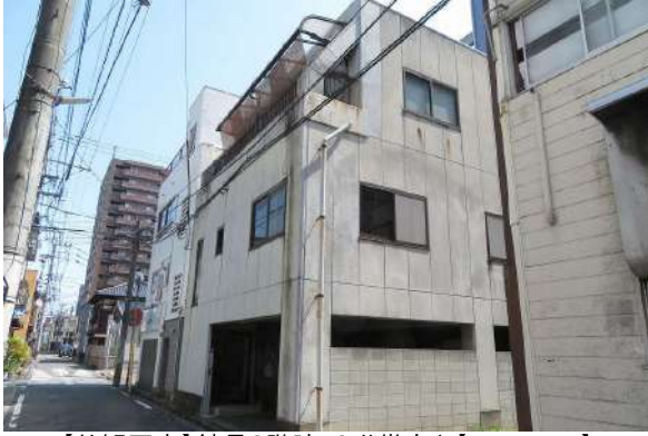
【外観写真】鉄骨3階建・2世帯向き(2DK+2K)