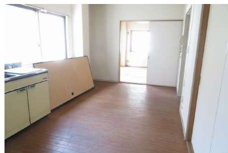
【ダイニングキッチン】2階のダイニングキッチンと奥が北側和室(2室とも角部屋)