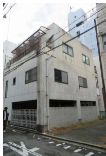
【外観写真】1階駐車場。2階2DK。3階2Kペランダ付き