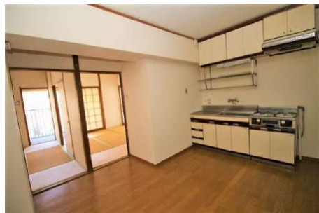
【ダイニングキッチン】