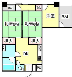
【間取り図】お好きにリフォーム可能