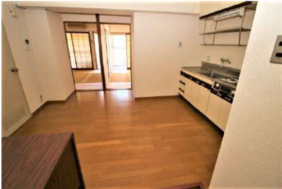
【ダイニングキッチン】