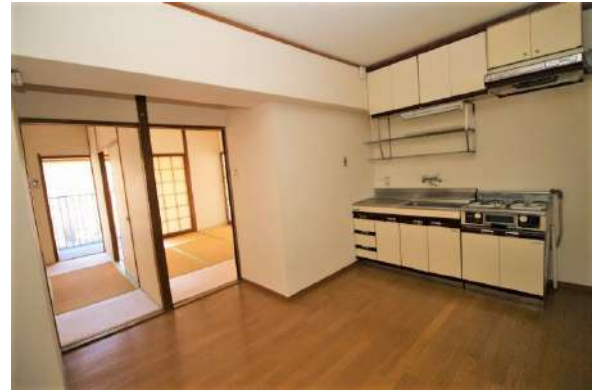
【ダイニングキッチン】