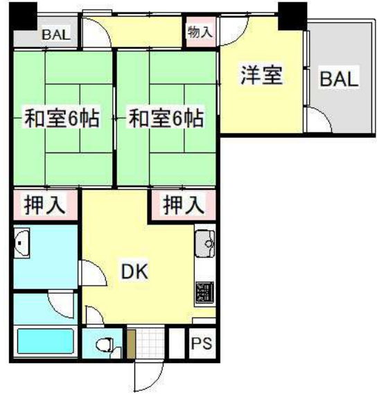
【間取り図】お好きにリフォーム可能