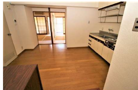
【ダイニングキッチン】