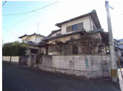
【外観写真】落ち着いた外観♪角地です!