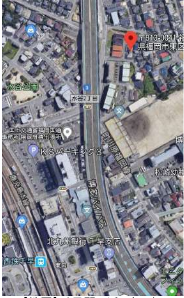
【地図】千早駅に近い!です。