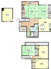
【間取り図】間取り図上が南になります。階段中段洋室あり、2階へと続きます。