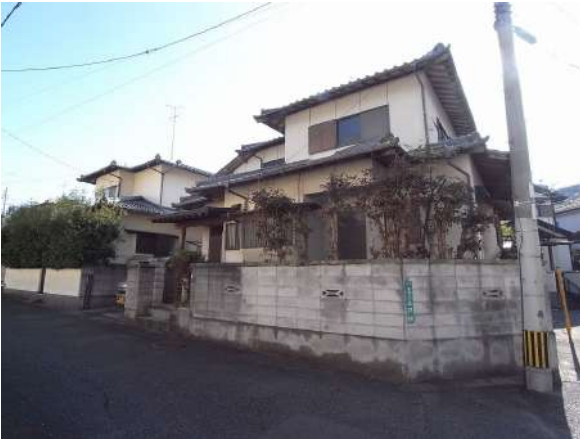
【外観写真】落ち着いた外観♪角地です！