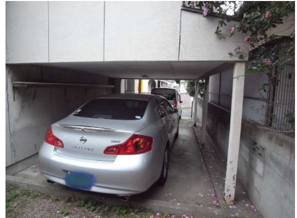
【現況写真】二台目の駐車は高さが約1.85m内の必要があります。