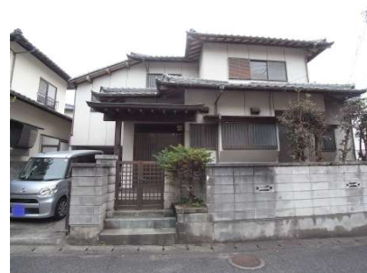
【外観写真】落ち着いた外観です♪