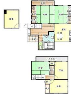
【間取り図】間取り図上が南になります。階段中段洋室あり、2階へと続きます。