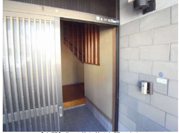
【玄関】明るく落ち着く玄関です♪