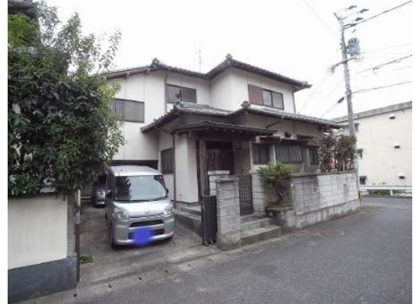
【前面道路含む現地写真】前面道路約5mあり、駐車も楽です。