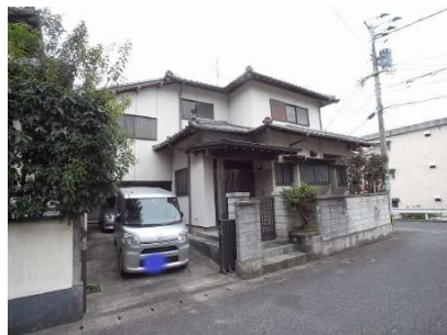
【前面道路含む現地写真】前面道路約5mあり、 駐車も楽です。