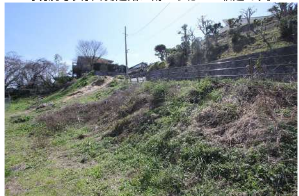
【現況写真】北西側→物件中心側