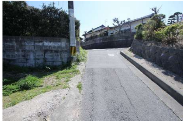
【前面道路含む現地写真】西側道路、北から