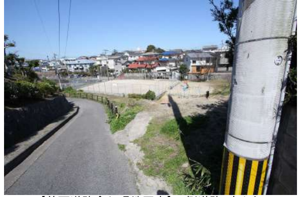
【前面道路含む現地写真】西側道路、南から