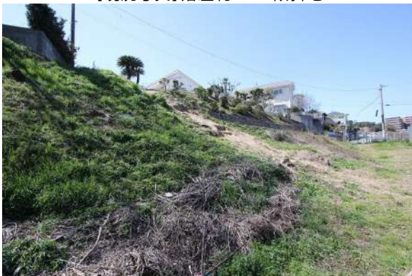
【現況写真】北東側→物件中心側