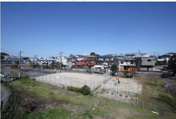
【その他】物件から菖蒲公園への眺望