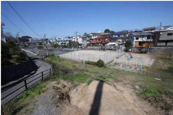
【現況写真】落差約6mの傾斜地