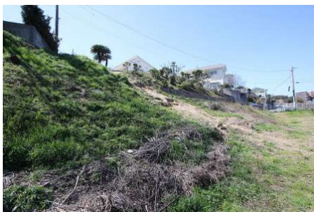
【現況写真】北東側→物件中心側