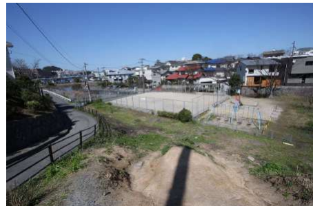
【現況写真】落差約6mの傾斜地