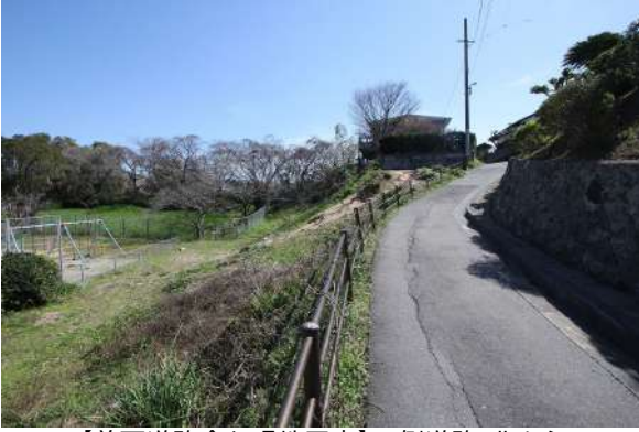
【前面道路含む現地写真】西側道路、北から