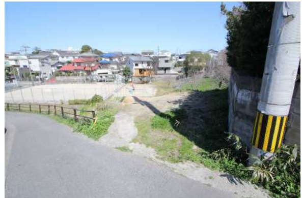
【現況写真】西側道路から車1台分のフラットな部分有。