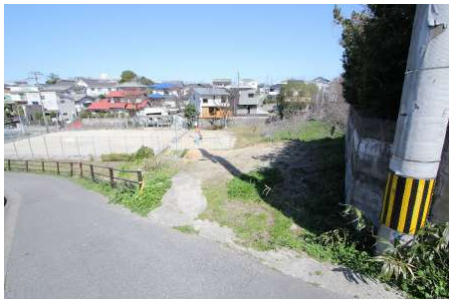
【現況写真】西側道路から車1台分のフラットな部分有。