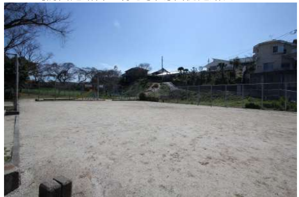
【その他】菖蒲公園から物件方向