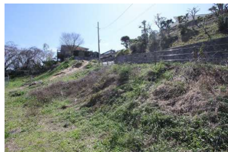
【現況写真】北西側→物件中心側