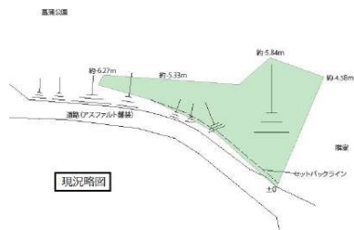
【土地図面】筑紫丘中校区内で56坪!