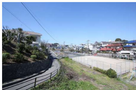
【現況写真】西側道路は南から北への坂道です。