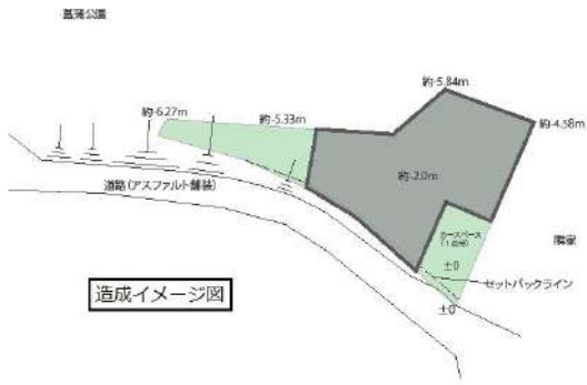
【土地図面】造成イメージ図