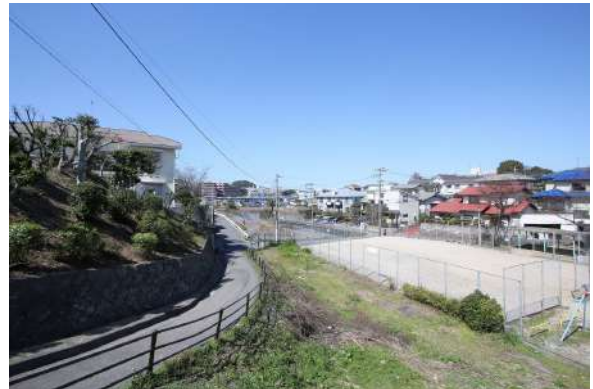
【現況写真】西側道路は南から北への坂道です。