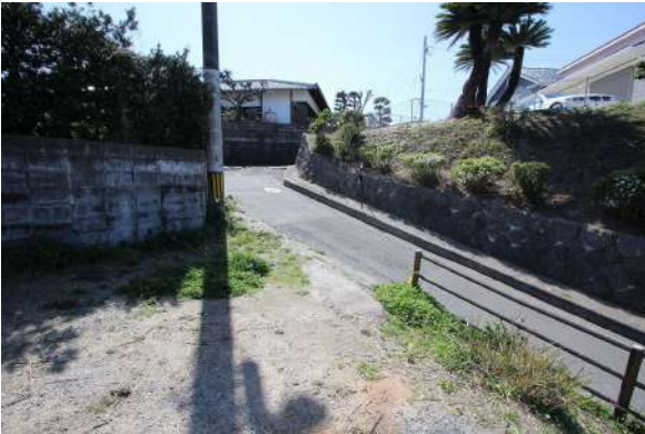
【前面道路含む現地写真】カースペースから西側道路