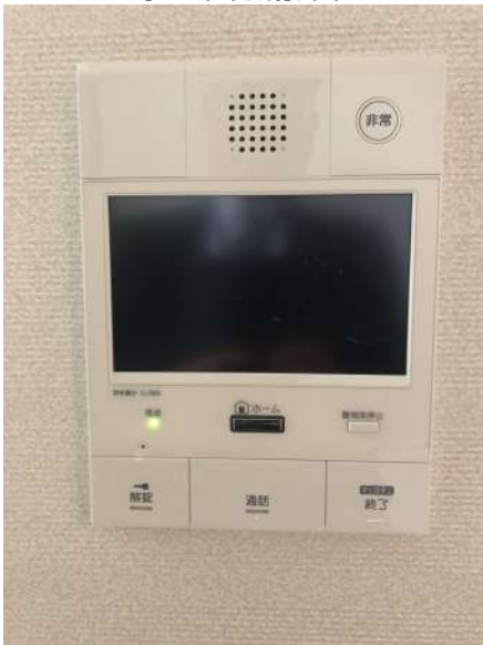
【TVモニタ付きインターフォン】