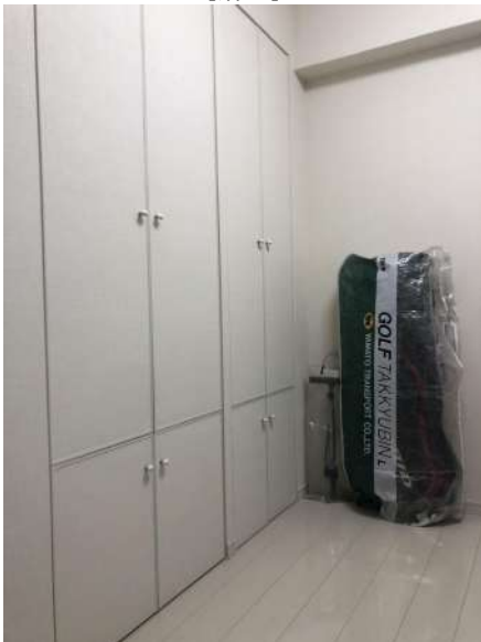
【洋室】クローゼット